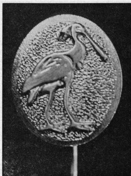
Het draagteken van de Nederlandse Vereniging tot Bescherming van Vogels 'De Gouden Lepelaar'.

Dit mag wel de grootste vogelbeschermingsmanifestatie in ons land sinds