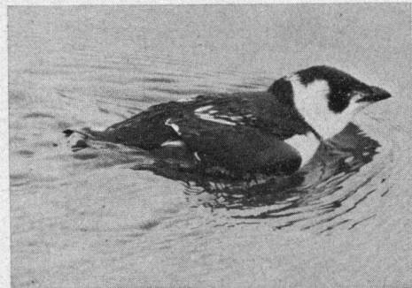
Kleine Aik op het wad, \pm 1 km van De Schorren, Texel, 24 oktober 1974.

Kleine Aik. 24-10 1 ex. \pm 1 km zuidelijk van De Schorren, Texel, zie foto (E. Bos); 27-10 1 ex. bij Koudekerkse Inlaag, Schouwen Duiveland in Oosterschelde bij Plompe Toren, vloog weg (F. v. Leeuwen, P. v. Dijk, L. Kool); 10-11 1 ex. Oostvoornse Meer (J. de Leeuw, echtp. Velthuizen); stormen veroorzaakten ook in Engeland binnenlandse waarnemingen o.a. op 26-10 109 ex. en 29-10 85 ex. in 2 uur in Norfolk. Ook stormvogeltjes leden onder de stormen.