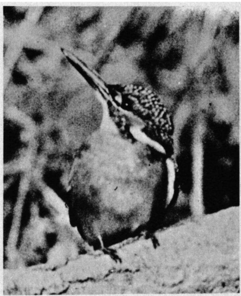
Plotseling zat hij daar op zijn vistak.