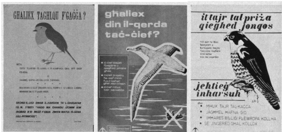
Posters ter bescherming van Roodborsten, tegen het schieten van broedende pijlstormvogels en ter bescherming van stootvogels.

Roodborsten, sinds 1911 beschermd door een wet waar niemand zich aan hield, werden elk najaar gevangen met speciale strikken en in een kool gezet door vele Maltesers. Door hun teerheid stierven zij natuurlijk allemaal binnen enkele weken of