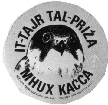
Malteser sticker t.b.v. stootvogelbescherming.

Ongelukkigerwijs wordt een jachtvergunning afgegeven zonder een leertijd of een examen. Bovendien is zij te goedkoop. Per jaar kost zij maar 3,30 Malteser pond (f 24,—). In Duitsland bijvoorbeeld moet de toekomstige jager een half jaar lang één avond per week lessen volgen om alle voorschriften en het gebruik en onderhoud van wapens te