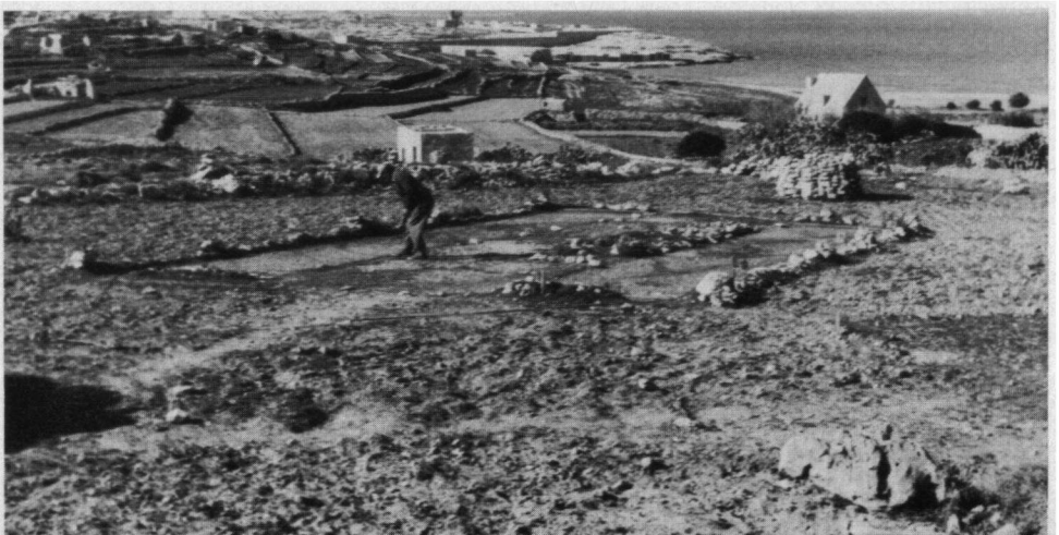
De vinker controleert zijn netten na een mislukte slag met zijn netten. Achter het muurtje op de achtergrond is zijn schuilplaats, november 1974.

Waar men wel iets aan doet zijn: het verbod om kooi-vinken te importeren en het verbod van bepaalde soorten ammunitie. Waar niets aan gedaan wordt zijn talloze overtredingen