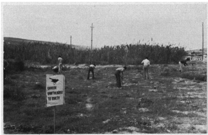
Leden van de jeugdafdeling van de OVM bezig met vrijwillig herbebossingswerk in Ghadira.