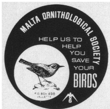
Malteser sticker met de Blauwe Rotslijster als embleem van de MOS.

geleken met de meer dan 20.000 Roodborsten, die in oktober en november 1970 werden gevangen, zijn het er nu ongeveer 1000.