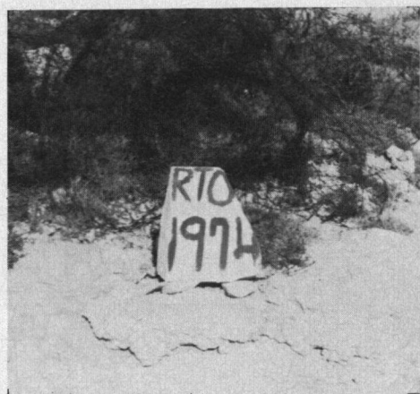
Het opschrift RTO staat op vele muren, torens, gebouwen en stenen op het platteland gekalkt. Het betekent 'Reservato', het gebied dat door een jager is gepacht, november 1974.