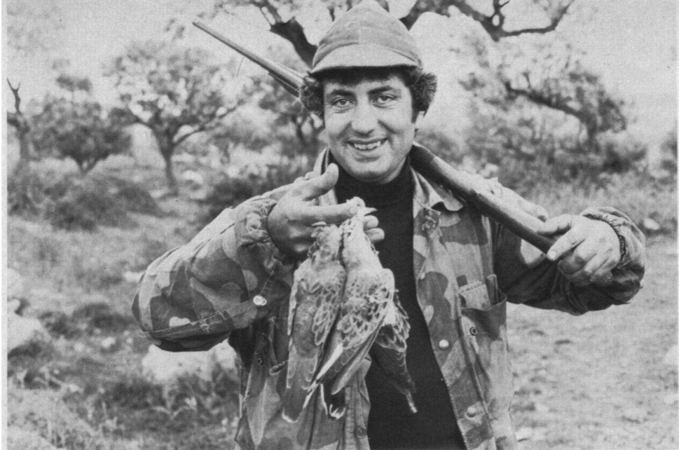
De bult van één der ruim honderd vogeljagers op een dag in de week op de Capo Colonna ten zuidoosten van Crotone, Calabrië, Italië, 29 april 1976.