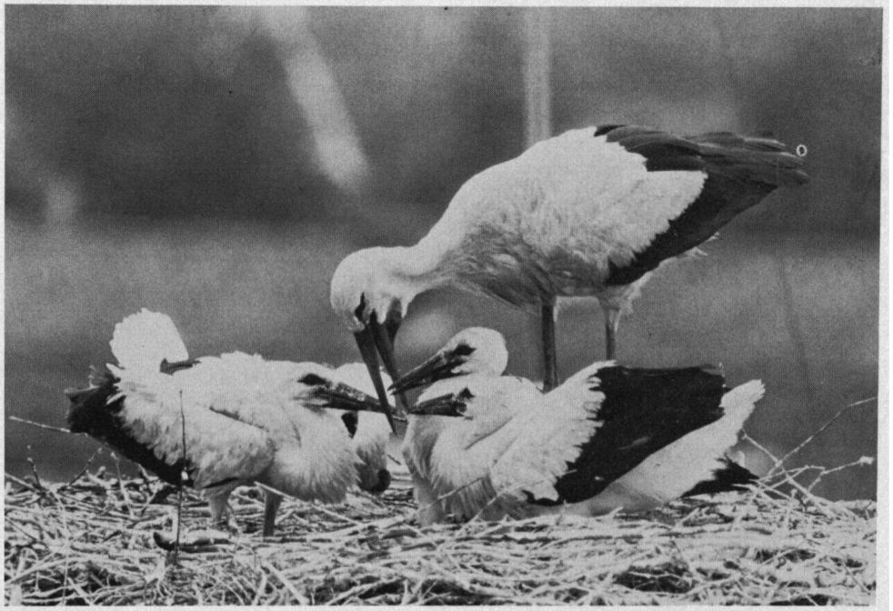
Het voederen van de drie jonge Ooievaars op het nest. Oudewater, 12 juli 1976.

Het aantal beschikbare nesten dat in ons archief is opgenomen, bedraagt momenteel 126 stuks. Uit incidentele mededelingen blijkt dat de staat van verscheidene nesten niet al te best is. Met hulp van de Nederlandse Vereniging tot Bescherming van Vogels en haar nestenbouwer W. Aldenhuysen en Staatsbosbeheer werden de nesten van Grafhorst, Wapenveld en Schoonrewoerd gerestaureerd. Naar aanleiding van de gevechten in 1975 bij het nest in Oudewater werd in Linschoten een nieuw nest geplaatst. Voorts bleken elders in Nederland nog een aantal nestgelegenheden te zijn gebouwd.