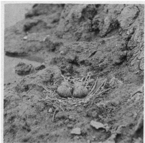
Nest van een Kluut in een sloot met onderbemaling