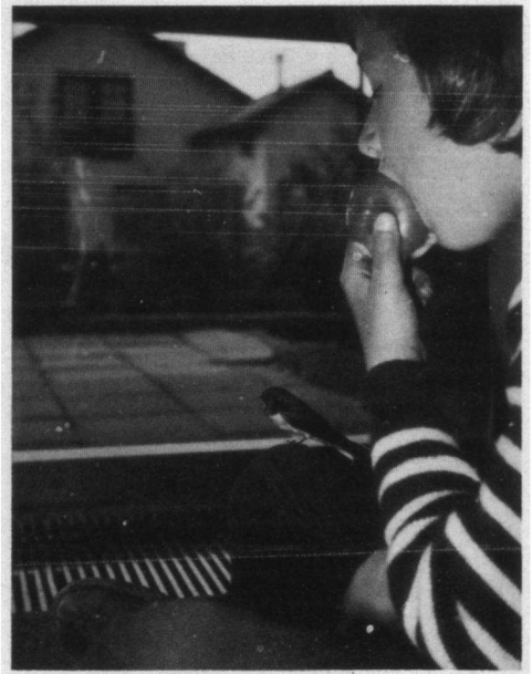
Boerenzwaluw in huis op de knie van mijn zoon.

We wilden wel eens weten, of onze veronderstelling dat het hier ons 'eigen' mannetje betrof, juist was en zetten hem