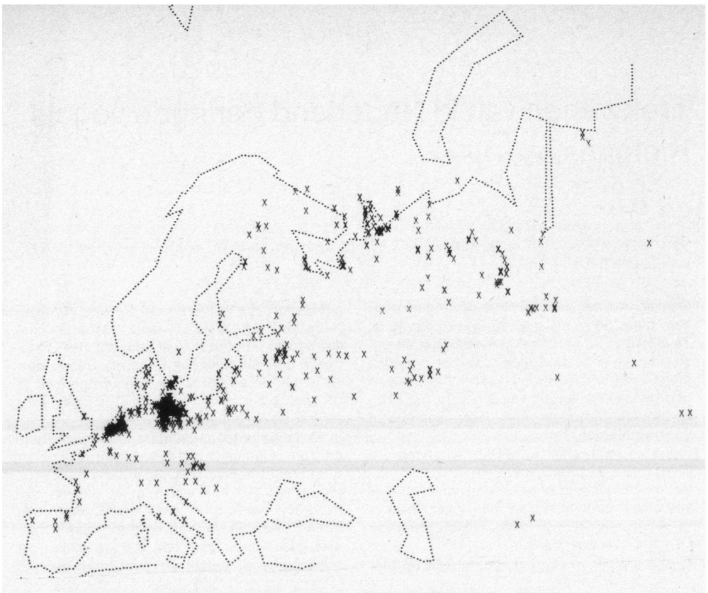
Fig. 2. Plaatsen, waar Rietganzen zijn geschoten, die in Nederland zijn geringd.