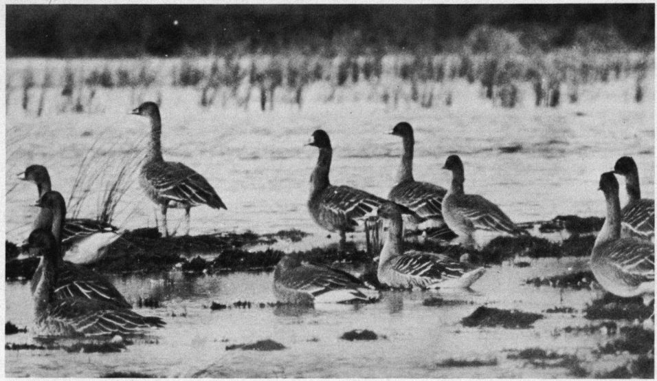
Rietganzen, Stabrechtsche Heide, oktober 1960.