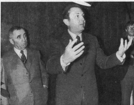
Minister Michel d'Ornano in gesprek met de voorzitter van de jagersvereniging de heer Dubourdeaux. Bordeaux, 13 mei 1979.

Kranten spreken van een 'Mei-revolutie' en een ware oorlogstoestand. Politieambtenaren