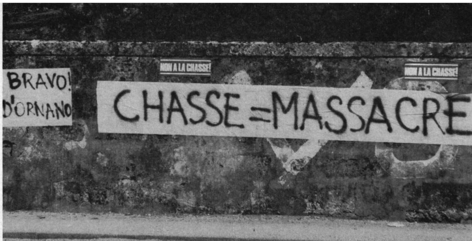
Tegenover het universiteitsgebouw te Bordeaux loofden de vogelbeschermers de houding van de minister van milieu, Michel d'Ornano, en veroordeelden scherp de voorjaarsjacht op Tortelduiven, 12 mei 1979.