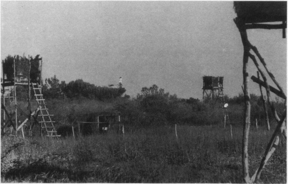
Langs de Gironde staan de pylônes voor de voorjaarsjacht op Tortelduifjes op korte afstand van elkaar opgesteld. Een typisch beeld dat men daar overal aan kan treffen! 13 april 1979.

De tijd was zodanig gekozen dat het juist plaatsvond tijdens het hoogtepunt van de verschrikkelijke voorjaarsjacht op de Tortelduiven langs de oevers van de Gironde. De jacht die voornamelijk plaatsvindt van de minstens 3 meter hoge jachthutten op stellages (hier pylônes genoemd) was er bij ons bezoek in alle hevigheid uitgebroken. Niet minder dan 9000 pylônes staan hier continue opgesteld, soms enkele tientallen meters van elkaar verwijderd. Maar ook geplaatst op caravans, schuren en zelfs zag ik meerdere malen een pylône op de zuidwestzijde van het huis ge-