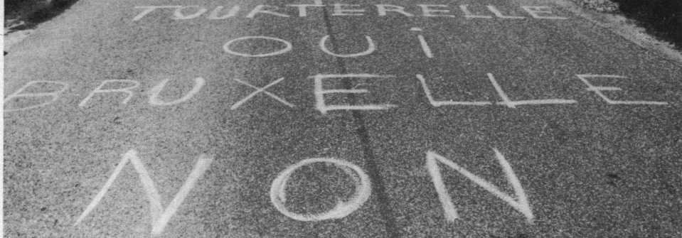
'Tortelduiven ja, Brussel neen' schilderden de jagers op de straatwegen die door de jachtgebieden lopen. Bas Médoc, 13 mei 1979.

richten weinig uit tegen het overheersende aantal torteljagers. Een jager die in de richting van een gendarme schoot is tot één maand gevangenisstraf en 700 francs boete veroordeeld. De toestand is uiterst gespannen en onze gidsen durven met de auto niet te stoppen in de 200 kilometer lange jachtstrook (spottend wel 'Ligne d'Ornano' genoemd) van de Gironde waar zich de ruim 9000 jagers voornamelijk ophouden. Zelfs op een vierbaans autoweg kunnen Roger Arnhem en ik onze gidsen niet tot stoppen krijgen, zodat om foto's te kunnen maken we de volgende dag er met eigen vervoer moeten terugkeren!