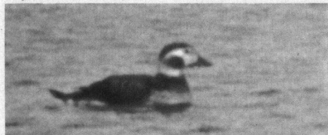
IJseend ♀, Uitgeest, jachthaven 'Kwalijk', 18 december 1978.