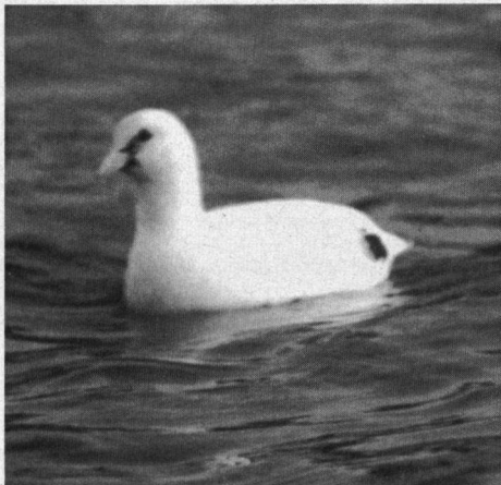
Albino Meerkoet, Ringvaart, Haarlemmermeer, medio november 1978.

Meerkoet. Winter 77/78 tot in winter 78/79 albino ex. ringvaart Haarlemmermeer tussen Aalsmeer en Oude Meer (D. Kaptein, med. P. de Jong, P. Klaassen).