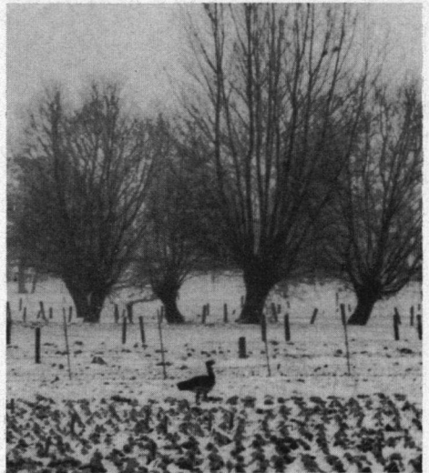
Grote Trap, Wageningse Binnenveld, 17 februari 1979.