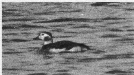
IJseend ♀, Uitgeest, jachthaven 'Kwalijk', 18 december 1978.