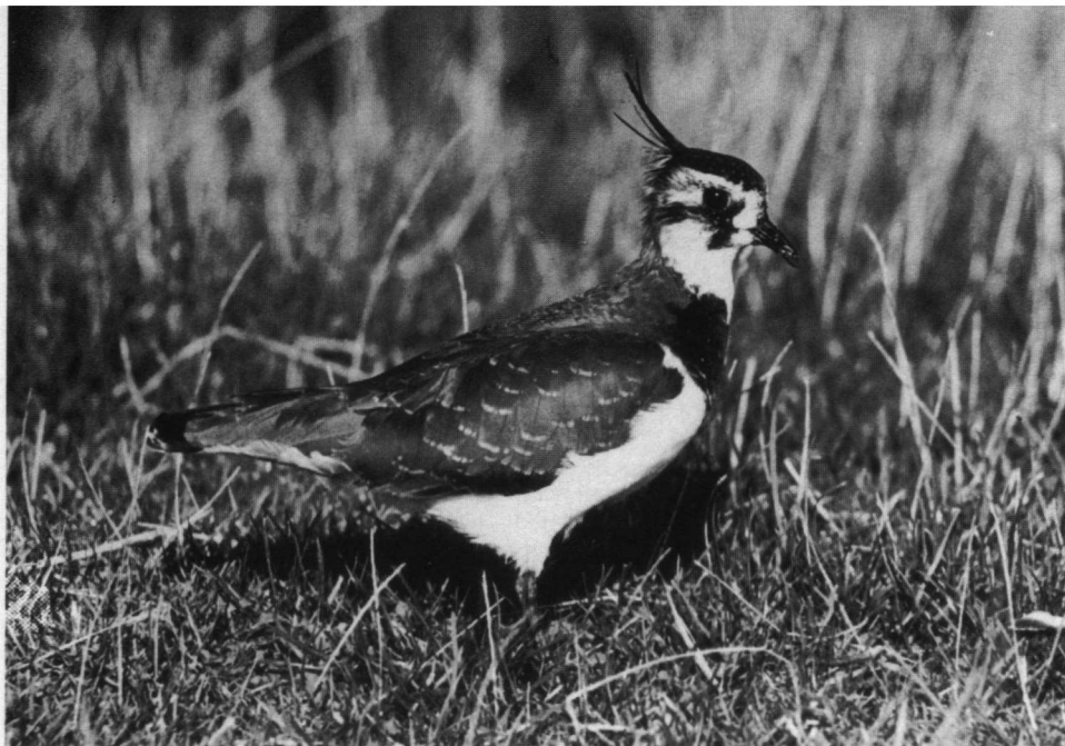
De nazorg gevende weidevogel-bescherming is bij ons welhaast onbekend, zodat het moderne boerenwerk overal vrij spel heeft en een zware tol van de broedsels wordt geheven . . .