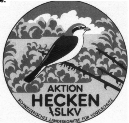
Zwitserse sticker 'Actie Heggen' met Grauwe Klauwier.

Om enige lijn in het werk van dezen en genen te brengen verzoeken wij alle groepen die zich met het heggen- en houtwallenonderzoek op enigerlei wijze willen gaan bemoeien dit aan ons te melden. Misschien kunnen wij dan binnen niet al te lange tijd