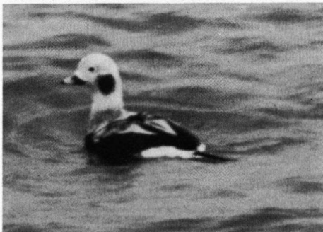
IJseend, mannetje, Oostvaardersdijk, hoek Knardijk, 31 oktober 1979.