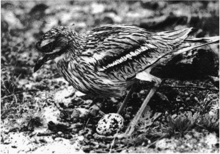
Griel zet zich op de eieren, Oosterkanaal, AW Duinen, mei 1923.