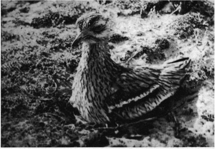
Broedende Griel, Oosterkanaal, AW Duinen, mei 1919.