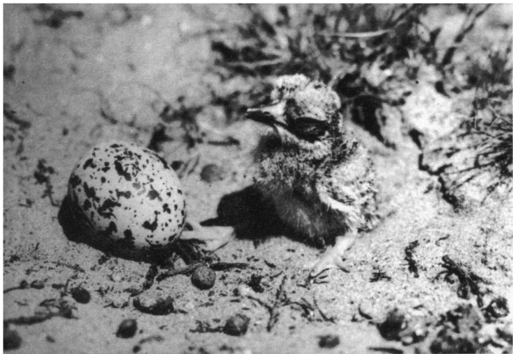
Jonge Griel, pas uit het ei. AW Duinen, 3 juli 1937.