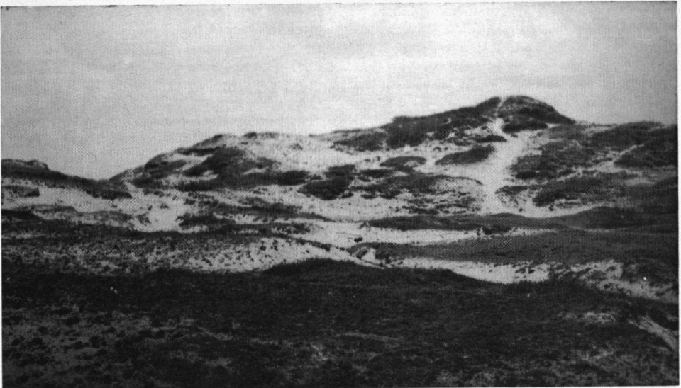
'Grielanduin', even ten zuiden van 'De Verbrande Pan', Bergerduinen.

Ze lopen zeer snel met kleine pasjes, waarbij de kop is ingetrokken het lichaam horizontaal gestrekt. Maar er is nauwelijks een vogel die zo veel verschillende standen en houdingen kan aannemen. Dat zien we vooral bij de curieuze ceremonieën die de paarvorming begeleiden. Er is welig verschil tussen de mannetjes en wijfjes en alleen aan het gedrag kunnen wij de beide sexen uit elkaar houden. Bij de paarvorming zien wij dat beide vogels wat houtierig naar voren buigen, waarbij de snavel de grond raakt en het achterlichaam omhoog geheven wordt. Vaak naderen zij elkaar, staan dan zij aan zij en kijken elk een kant op met rechtop staand lichaam, waarbij zij de hals omlaag buigen en zo blijven ze enige seconden doodstil staan. Daarna heeft de paring plaats. De Engelse ornitholoog Thompson zag hoe een mannetje in gebukte houding naar een wijfje liep. Het wijfje riep en bewoog de hals zacht op en neer, daarna ging ze rechtop staan terwijl het mannetje haar keer op keer passeert, heen en weer wiegend en gedraagt zich daarbij alsof hij gewond is. Bij de aflossing op het nest zag ik hoe de broedende vogel met een snelle beweging sprietjes en een konijnkenutel schuin over zijn rug wierp, zoals we dat ook bij tal van andere vogels zien. Kluten hebben daar ook een handje van, evenals Kleviten.