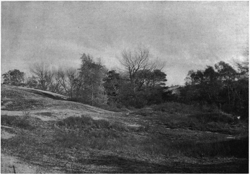
Langs de binnenduinstrand 'De Donderhoek', Vogelenzang, mei 1919. Dit was een geliefd broedterrein van de Griel.

lijk verbonden is aan het industrieële bedrijf. Met weemoed denk ik terug aan de tijd toen wij Kievitseieren zochten in het weidelandschap tussen het Spaarne en de Schoterweg, thans geheel bedekt door de huizenzee van een belangrijk stadsdeel van Haarlem. Toen nestelden er nog Zwarte Sterns in de fortgrachten van de vestingwerken van Spaarndam, had je kans op Wouwaapjes en kon je genieten van de bloeiende lentesklokjes, welke toen nog voorkwamen op het eilandje in de 'Mooie Nel' in het Spaarne bij Spaarndam.