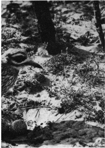
AW Duinen, mei 1919.