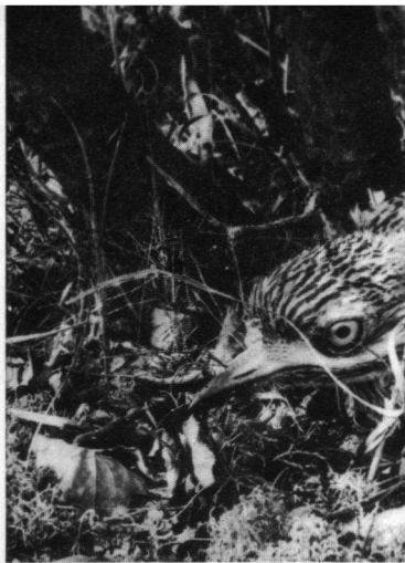
Jonge Griel, bijna vliegvaardig drukt zich.