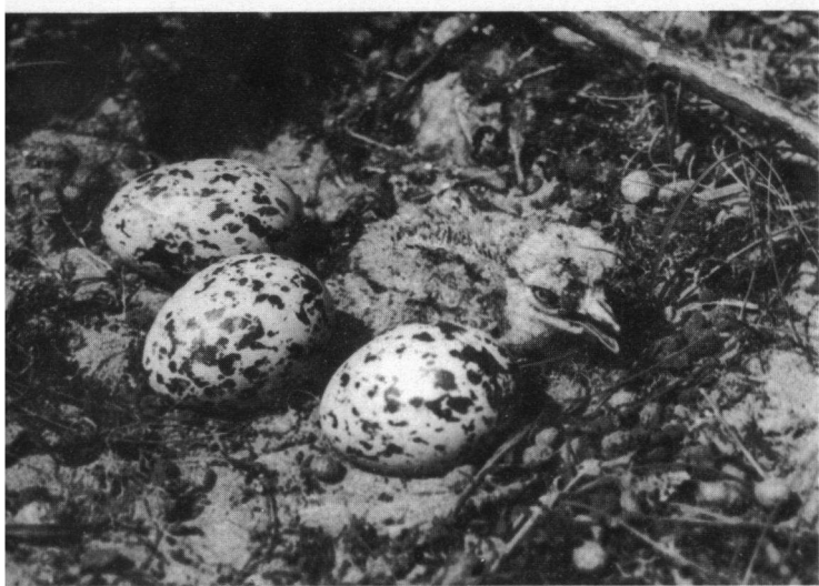
Pasgeboren Griel. Twee legfels van twee verschillende wijfjes bij elkaar gelegd.