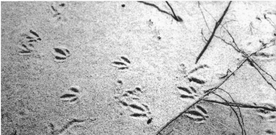
Grielenprenten in de AW Duinen, 1923.