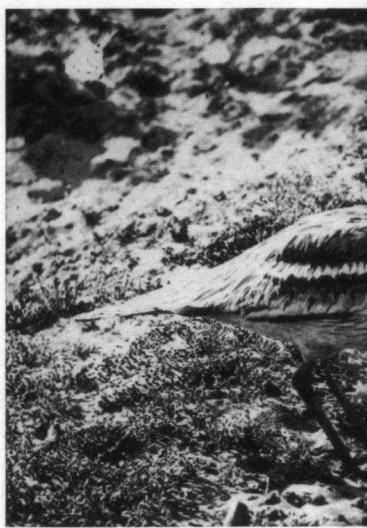
Griel bij nest met eieren.