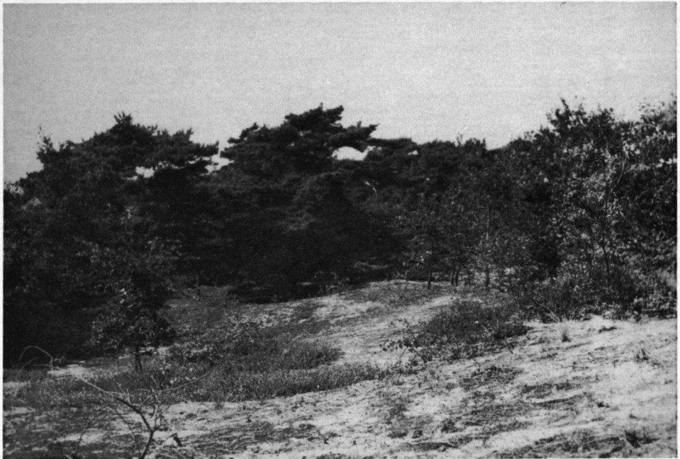
Langs de binnenduinrand. Hier huisden elk jaar de Grielen. AW Duinen, mei 1927.

veertje is onverschillig of het een boven- of ondervleugeldekveer of een stuitveertje is, onmiddellijk als van een Doornsluiper te herkennen. In het boek van dr. P. G. Buekers 'Onze Gevederde Vrienden' vinden wij op pagina 167 een goede foto van deze grielenveertjes. Zij vormen met de gevonden voetprenten vaak de sleutel, waardoor wij wat meer te weten komen over het gedrag van deze geheimzinnige vogel. Niet zelden kunnen wij daardoor ook het nest vinden. Van een nest is nauwelijks sprake. Het is een ondiep kuiltje in het zand, veel kleiner en minder diep dan het broedkuiltje van de Scholekster en in het terrein waar een grielenpaar zich heeft gevestigd vinden wij niet zelden meerdere van die kuiltjes die de koddebeilers 'schraveltjes' noemen. In een van deze kuiltjes verschijnen dan de beide eieren. De eerste eieren verschijnen als regel zo tegen het midden van april. De vroegste datum waarop wij een grielennest vonden was 11 april. Dat was in 1911 en het nest ontdekten wij tijdens een sneeuwbul in de Bloemendaalse duinen en bevatte slechts één ei. Hoe het met dat broedsel gegaan is, bleef onbekend, want wij konden de juiste plek niet meer terugvinden. Maar ook later in het voorjaar tot diep in mei en begin juni vonden wij eieren van de Griel. Ook verder in de zomer werden nesten ontdekt. Zo vond ik eens in 1922 op 13 augustus een nest met twee aangeplikte eieren. Het gaat