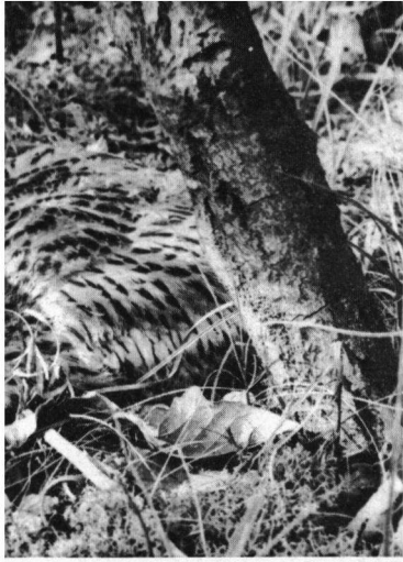
AW Duinen, 30 juni 1940.