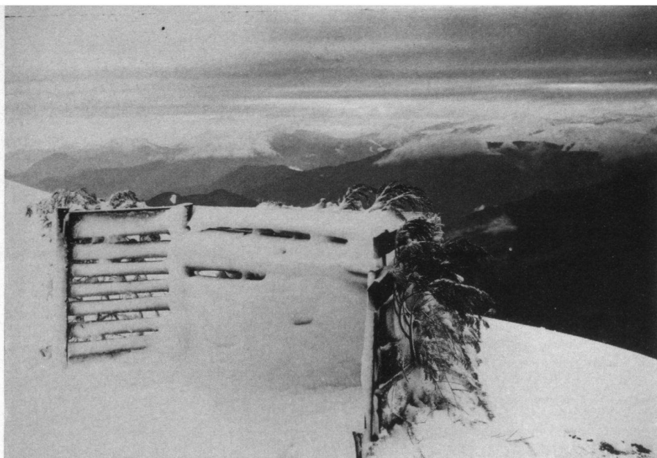
Een nog niet bezette schietpost, van waaruit men uitstekend zicht heeft op de aankomende trekvogels over de besneeuwde toppen van de Pyreneeën, 19 oktober 1980.

en mannetjes/wijfjes wordt voor elk soort nagegaan. De inleidende proeven voor een verder uit te werken studie over het type van het verenkleed van de Wespindief werden ondernomen; verwacht wordt dat deze studie tegen 1981 afgerond kan zijn, evenals over de trek van Zwarte Wouw door C. Keulen.