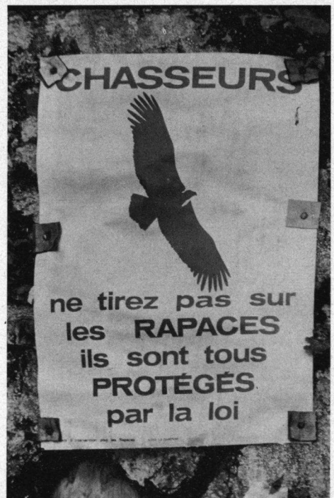
Deze posters kon men overal op de bergwegen van de Pyreneeën aantreffen. Opgehangen óók dank zij uw financiële hulp.

De 17 bejaagde bergpassen, die onze speciale belangstelling hebben, strekken zich lijnrecht uit over een afstand van 5000 meter. De