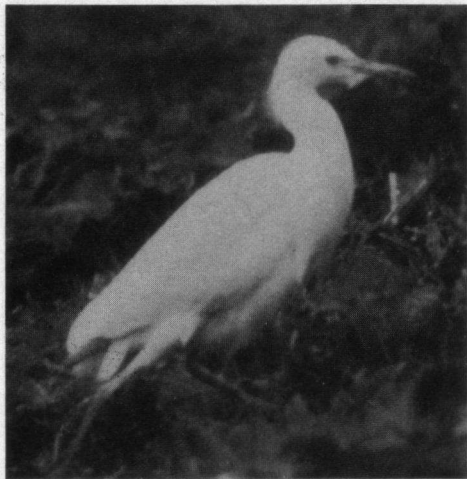
Koereiger bij Den Donk, 13 juni 1980.

Op zaterdag 13 juni 1981 werd er een Koereiger bij Den Donk in de Alblasserwaard ontdekt. De Koereiger is die dag verschillende keren waargenomen door diverse vogelaars. Hij kon ook nog gefotografeerd worden. Op 17 juni 1981 werd hij bij Den Donk voor het laatst gezien. Op 27 juni 1981 werd hij opnieuw ontdekt, maar nu in de polder van Oud-Alblas, zo'n 3 kilometer van Den Donk. De laatste keer dat hij gezien werd was op 2 juli 1981.