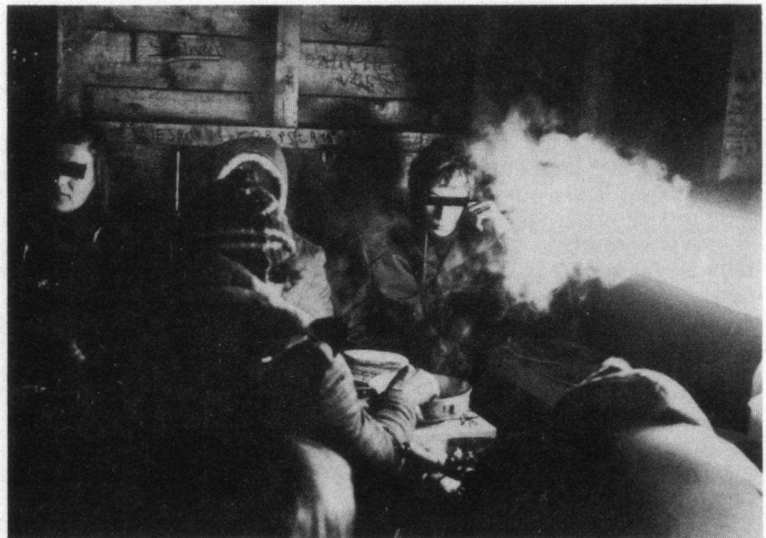
Saté maken in de observatiehut aan de Knardijk, 27 december 1981.

■ Peter L. Meininger, Greveilingenstraat 127, 4335 XE Middelburg & Wim C. Mullié, Herberdsland 66, 4337 CP Middelburg.