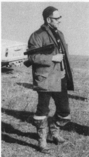
Dobrogea, Roemenië, november 1971.