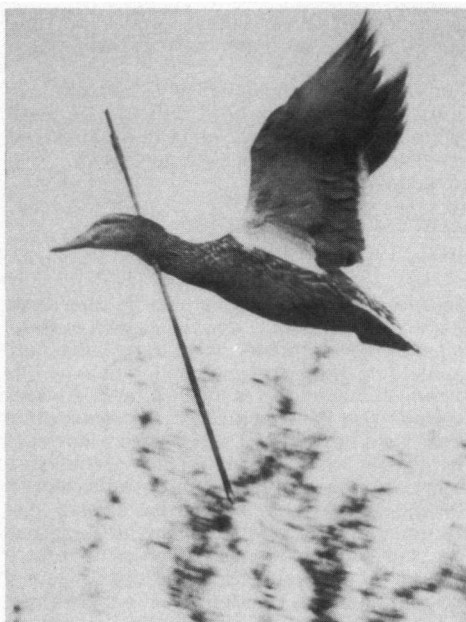
De wijfjes Wilde Eend 'Tine' werd met een 50 cm lange pijl door de hals in West-Duitsland aangetroffen in juni 1982.