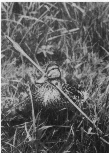
Het is bijzonder verontrustend, dat nog steeds weer vogels met pijlen worden aangetroffen. Deze wijfjes Wilde Eend, die in juni 1982 in West-Duitsland werd gefotografeerd, werd 'Tine' gedoopt.