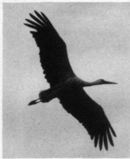
Ooievaar, Schoonrewoerd, 12 juli 1980.