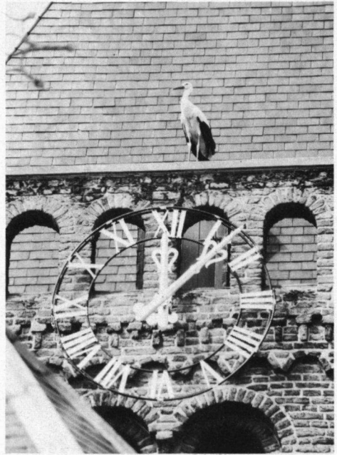
Zó slecht staat het er met de wilde Ooievaar in Nederland voor. Schoonrewoerd, 9 augustus 1980, jonge Ooievaar.

Door het aflezen van ringen kon de herkomst van veel geringde Ooievaars worden achterhaald. De meeste geringde exemplaren bleken projectooievaars te zijn. Zij werden gezien in Amen (D.), Alphen a/d Rijn (Z.H.) later in Apeldoorn (Gld.), Nootdorp (Z.H.), Wassenaar/Voorschoten/Den Haag (Z.H.), Druten (Gld.), Zuilichem (Gld.) Bergambacht (Z.H.), Schalkwijk (U.), Wijk bij Duurstede (U.), Zundert (N.B.), Raalte (O.) en Gramsbergen (O.). De waarnemingen uit de ooievaarsdorpen wijzen erop dat de Ooievaars zich daar soms enige tijd ophouden en vervolgens weer gaan zwerven. Uitwisseling tussen de ooievaarsdorpen werd eveneens geconstateerd. De doodgevonden Ooievaar in Voorschoten was een projectooievaar in het achtste kalenderjaar, die op 29 maart 1977 in Groot Ammers was geringd. Het broedpaar in Wassenaar bestond uit een projectooievaar waarvan de ring reeds op 8 januari 1980 bij Mariahoeve (Den Haag) was afgelezen. Dit ♂ was op 22 maart 1979 geringd. Het ♂ droeg een ring van het Dierenpark Was-