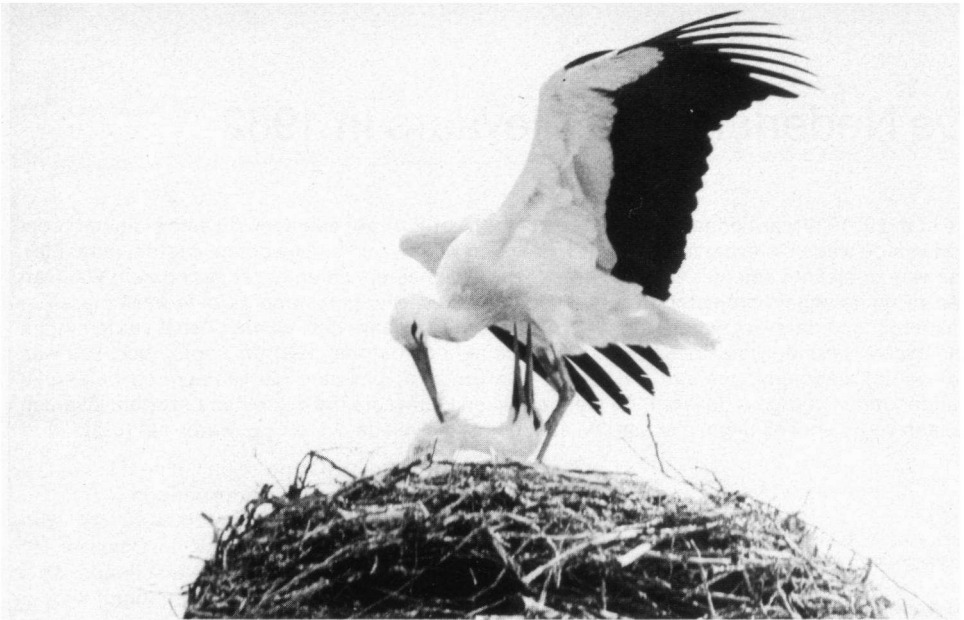
Ooievaars op het nest. Kootwijkerbroek, mei 1982.