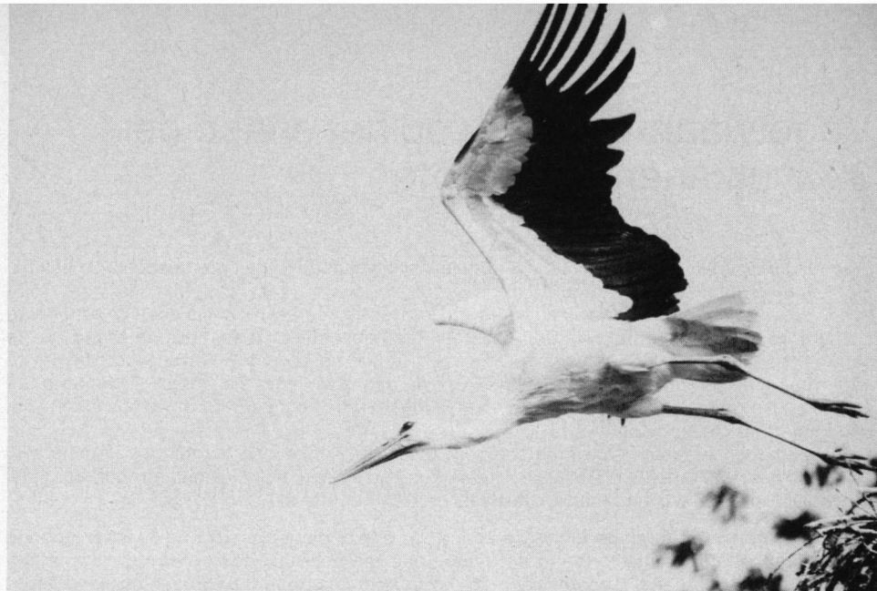
Adulte Ooievaar van het nest afvliegend, Schoonrewoerd, 25 juli 1980.