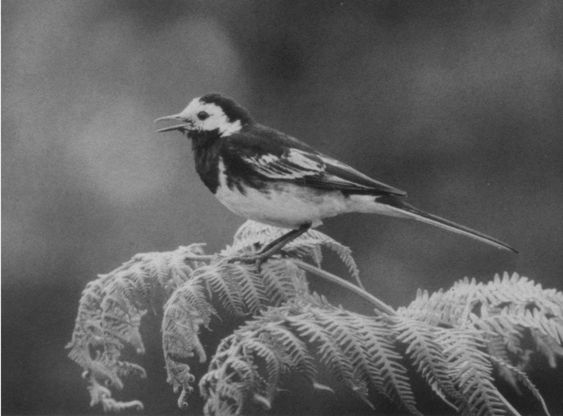
Derde Prijs. Rouwkwikstaart, 26 juli 1983, Goatland, Yorkshire, Engeland. Pentax MX, Novoflex 600 mm.