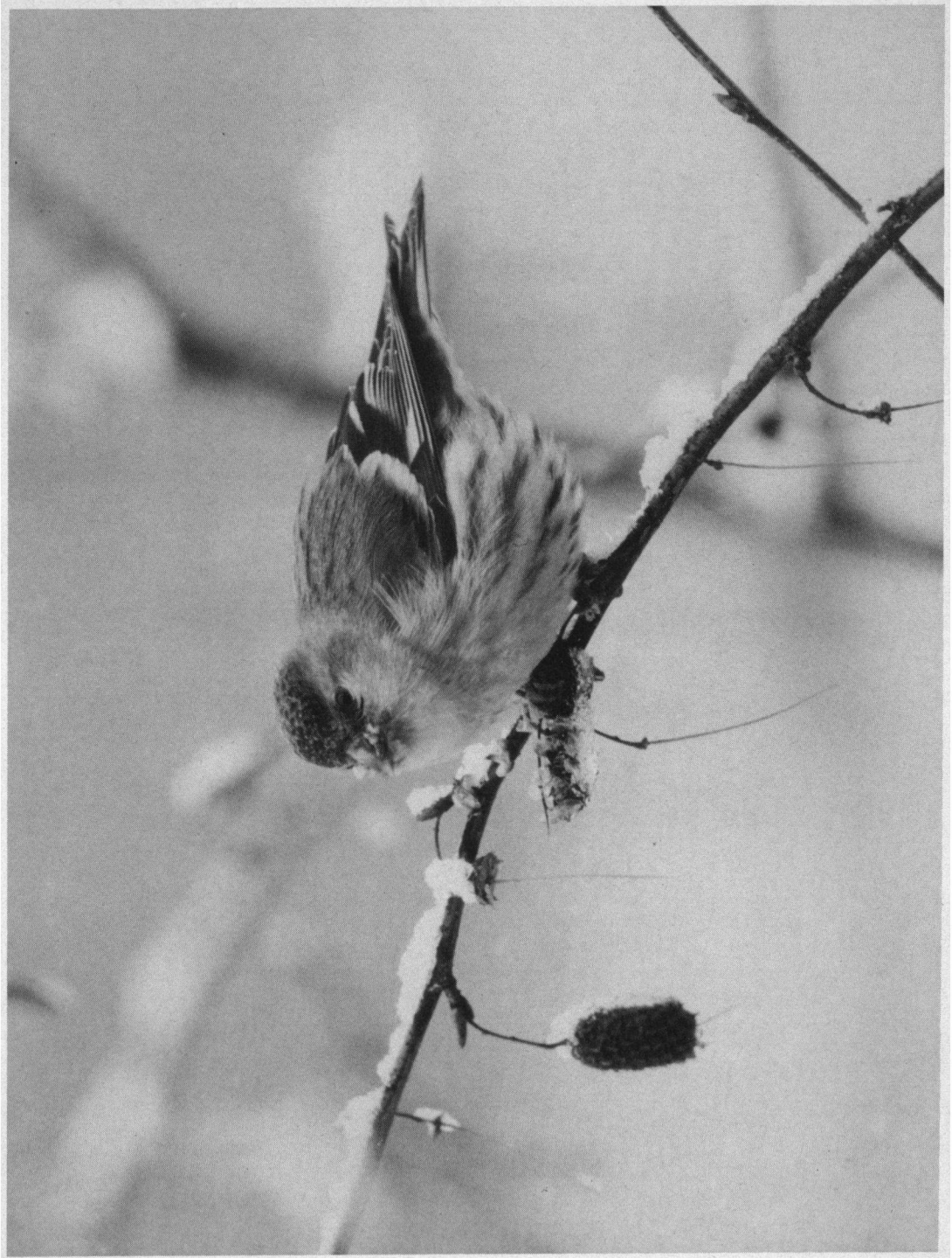
Eerste prijs. Mannetje Sjls op besneeuwde berkentak, 12 januari 1982, Veldhoven. Pentax Spotmatic, Novoflex F8/600 mm.