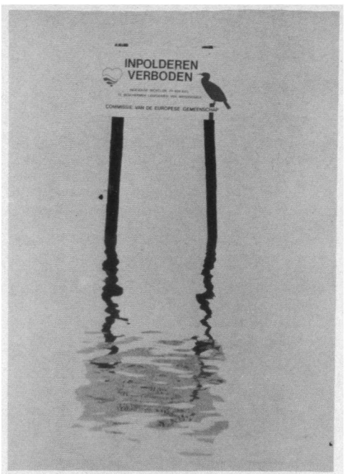
Zorgt u ervoor adhesie te betuigen ?

Nederlandse regering moet de samen overeengekomen Richtlijn 79/409 respecteren. Onze regering is wel vaker wat erg laat met het aanpassen van de Nederlandse wetgeving, hetgeen tot desastreuze ontwikkelingen kan leiden. Duidelijk is dat de Nederlandse regering tot op heden in deze kwestie in gebreke is gebleven'.