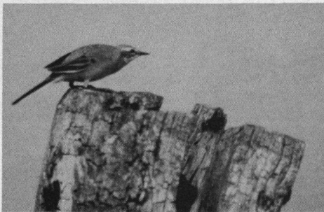
Gele Kwikstaart in verstarde houding, Neusiedl, mei 1982. Naar een kleurenfoto van Rob Jeltjes.

De wandeling van Weiden, bij Neusiedl aan de noordkust van het door brede rietkragen omzoomde meer, naar Poldersdorf aan de oostkant en terug kan zeer lonend zijn. Er valt dan een grote verscheidenheid aan vogels te zien op deze route, met name ook diverse soorten trekvogels.