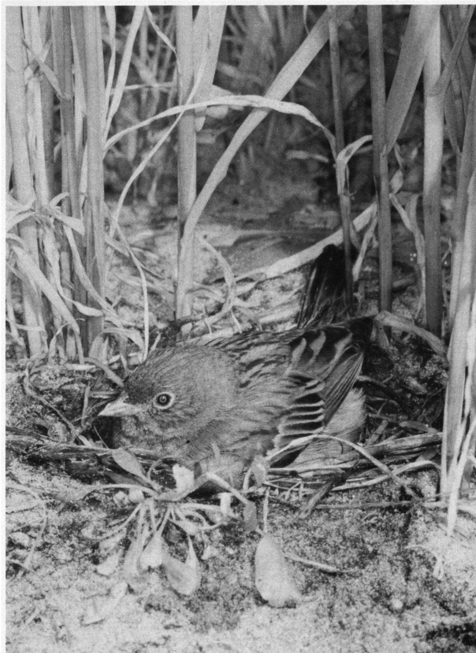
Hoedende Ortolaan. Nooit naar zoeken...