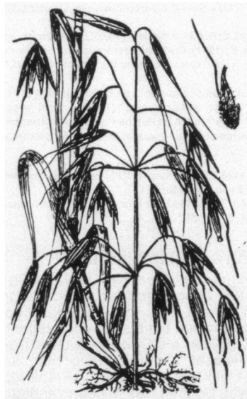
Op droge hoge plaatsen, waar niets wilde groeien, kwam in Noord-Brabant vroeger de haversoort Even ( Avena fatua ) voor.

Na de laatst genoemde datum zijn geen notities over Ortolanen in Casteren meer gemaakt, omdat er bij korte bezoeken in de maand mei geen Ortolanen meer werden aangetroffen. In Dommelen waren zij toen ook al verdwenen.