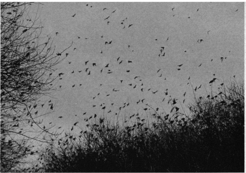
Spreeuwen op de slaapplaats.