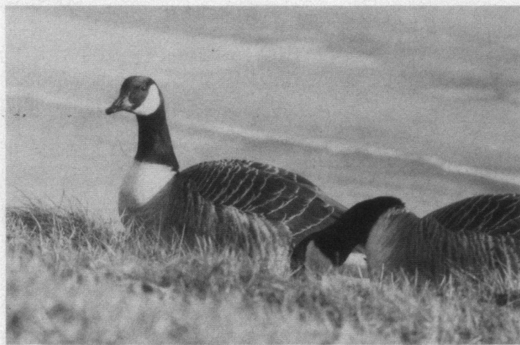
Canadese Ganzen, Winkelweg, Zuidelijk Flevoland, 27 januari 1985.

Boerenzwaluw. 3-4-85 4 ex. rondvl. Davidsplassen,