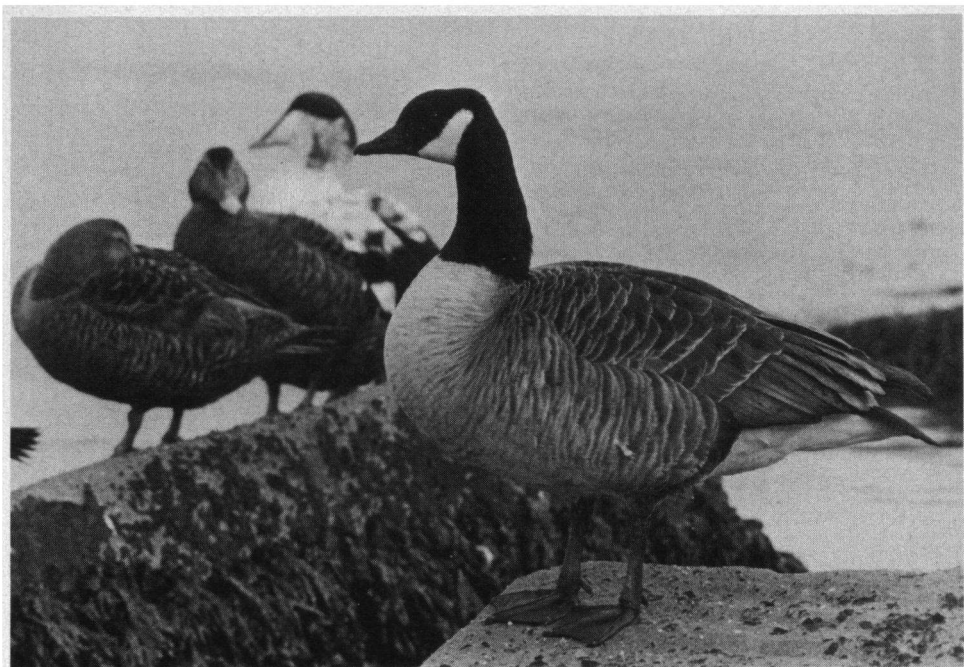
Canadese Gans en Eidereenden, Zuiderhavenhoofd, Scheveningen, 23 maart 1985.