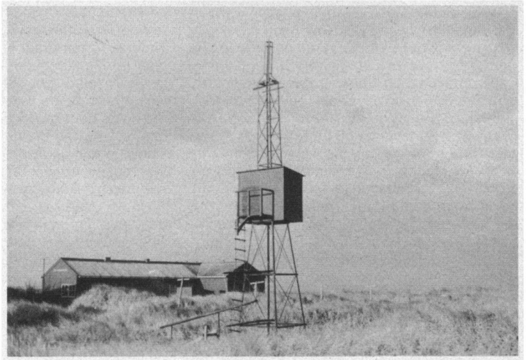
Rottumerpleat 1956.

brenge. Deze zou, als het er veel waren de vogels tijdelijk in de zak stoppen, om ze daarna zo snel mogelijk geringd weer los te laten. Zo gezegd, zo gedaan. Jaap was er druk mee. Anne en ik liepen te sjouwen met Scholeksters en voor de verandering af en toe met een Bonte Strandloper of een Zilverplevier. Wij brachten soms 2 of 3 vogels tegelijk. Ik herinner mij hoe ik met onder mijn beide oksels elk een Scholekster en tevens een Scholekster in mijn linkerhand, met mijn rechterhand — waarmee ik de lamp vasthield — een afwerende beweging maakte om te voorkomen dat een Bergeend in mijn gezicht vloog. Toen ik mijn arm na de botsing naar beneden deed bleek dat ik de Bergeend tegen mijn borst had geklemd. Jaap verlostte mij snel van deze jagerslatijnachtige buit. Hij had zelf eerder ook al een Bergeend gevangen. Anne kwam even later met 4 Scholeksters tegelijk aanzetten. Hij had de vierde op identieke wijze bemachtigd!