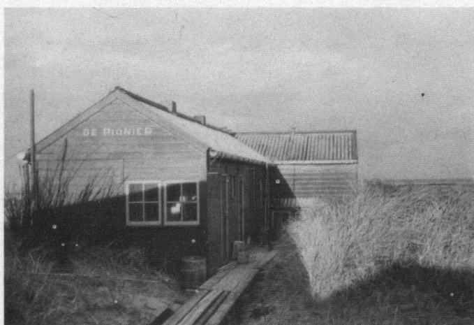
Het onderkomen van de Rijkswaterstaat, 'De Pionier', Rottumerplaat.

Toen Jaap's lamp duidelijke tekenen van vermoeidheid begon te tonen, werd besloten dat Anne en ik de vangstpogingen voort zouden zetten en onze buit telkens bij Jaap zouden