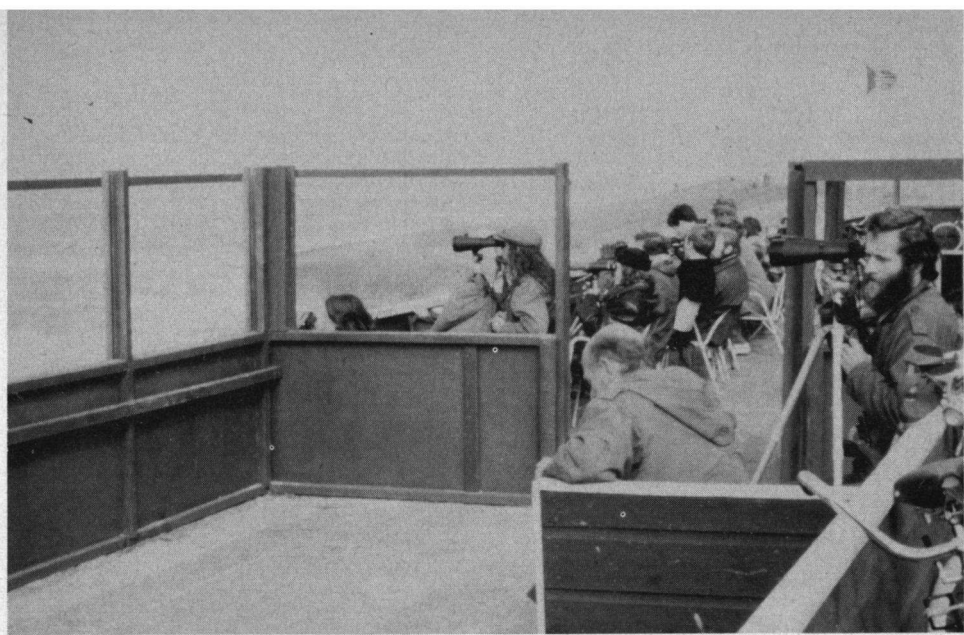
Op deze plaats zijn al veel waardevolle gegevens over de trek van zeevogels verzameld: de Hondsbossche Zeewering.

bleek hoe strak hij zich aan deze stelregel had gehouden.