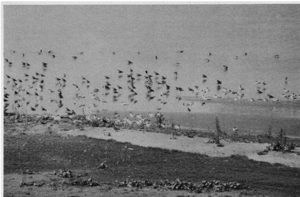
Velen gaan alleen op pad om te genieten van het kijken naar vogels en dat kan hier zeer goed. Strandje langs de Knardijk.

bladzijden in de wacht en de Blauwe Reiger tweeëntwintig. Hoezeer de kennis over vogels de laatste jaren toenam moge blijken uit het feit dat de samenstellers van het werk anno 1982, zestien jaar en zeven delen later, drieëntachtig bladzijden nodig hebben om de bekende, relevante zaken over de Kokmeeuw in het 'Handbuch' onder te brengen. Daarmee wordt tegelijkertijd treffend het probleem geïllustreerd waarvoor Glutz von Blotzheim zich geplaagd ziet: welke omvang krijgen de delen niet als de serie begin jaren negentig op een einde loopt. En dan pas aan te vangen met de bewerking van de eerste delen of nu al...?