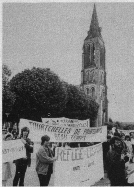
Links boven: Op het marktplein van Lesparre demonstreerden ruim zevenhonderd vogelbeschermers uit alle delen van Frankrijk en Europa.