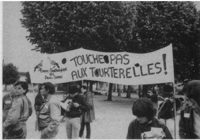
Eén van de vele spandoeken op het marktplein van Lesparre. De Groupe Ornithologique des Deux-Sèvres laat weten 'Kom niet aan de Tortelduiven!'.