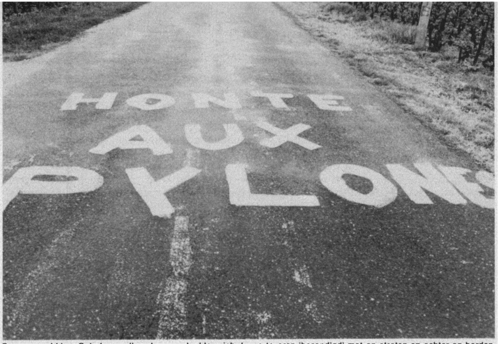
Boven en midden: Ook de vogelbeschermers hadden zich daags tevoren 'bezondigd' met op straten en achter op borden langs de wegen te schilderen 'Honte aux pylones' ('schande voor de jachthutten').