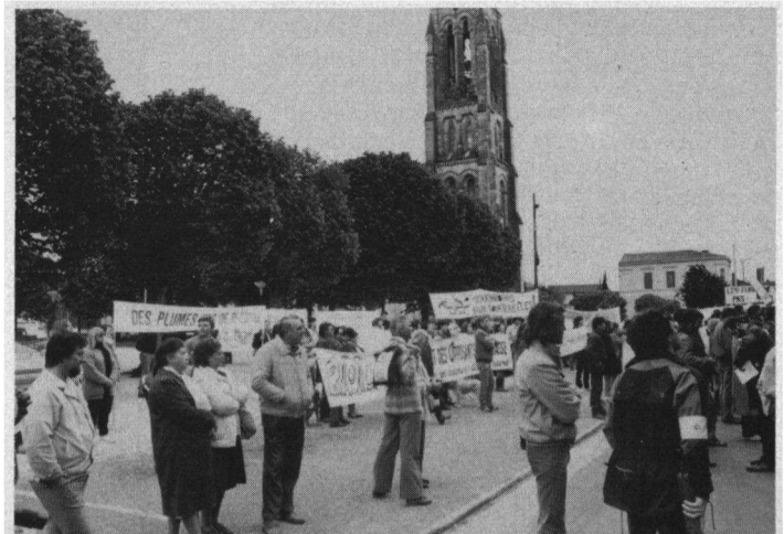
Onder: Vele spandoeken op de vroege zondagmorgen op het marktplein van Lesparre.

Het voorjaarsjachtschandaal heeft hiermee een climax bereikt en wij hopen dat de Franse regering nu met sterkere acties zal komen om de moord op de Tortelduiven te beëindigen. ■