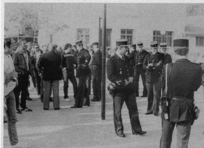
Midden: Op zondagmiddag werd tijdens een rondrit van vogelbeschermers door het gebied in bussen en particuliere auto's de weg voor de vogelbeschermers versperd door groepjes jagers in het midden van een klein dorpje. Een groot aantal leden van de oproep politie moest letterlijk en figuurlijk tussenbeide komen en vormde 'een haag' tussen de twee groepen.