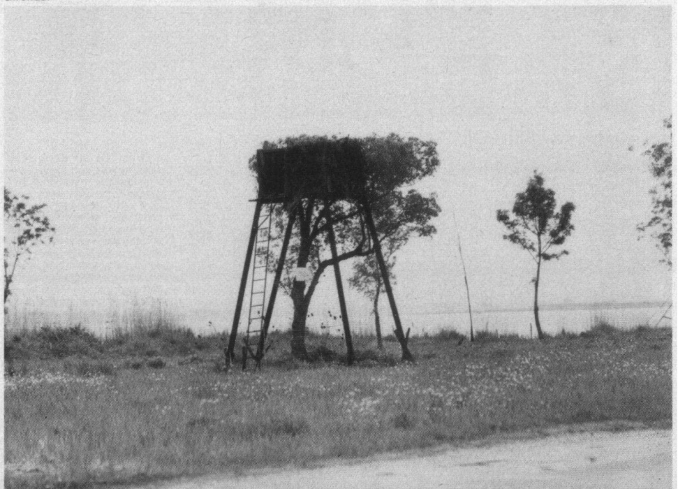
Eén van de 3400 'pylones' (schiethutten die verhuurd worden) voor het schieten van Tortelduiven langs de linker oever van de Gironde.

Na de bijeenkomst werd een oriënterende rondrit voor de vogelbeschermers gehouden door het omstreden gebied. De lange stoet bussen en particuliere auto's werd in een klein dorpje door woedende jagers tegengehouden. Lange tijd vormde een haag van leden van de Franse oproerpolitie in de stromende regen de scheiding tussen de schel-