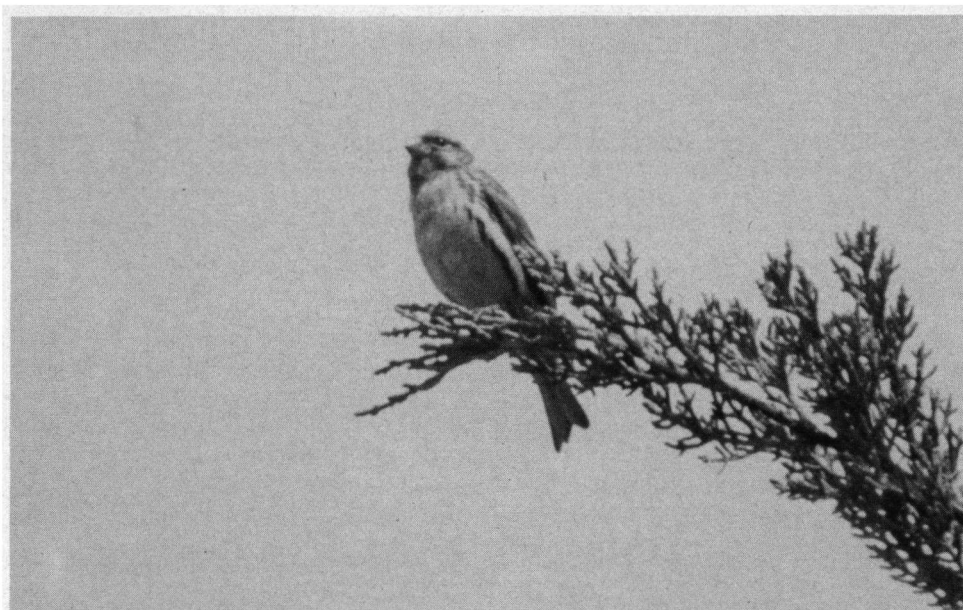
Eén van de bijzondere soorten die het park herbergt is de Europese Kanarie.