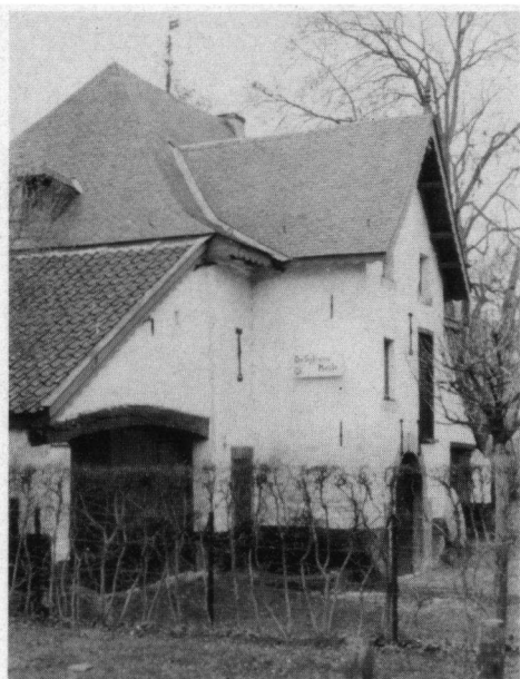
De watermolen is gerestaureerd in 1975 en ook te bezichtigen.

In het vogelbroedbos zijn enkele broedruiters geplaatst. Dit zijn door korte staken bij elkaar gehouden stapels doornig hout, waarin vooral Merels en Zanglijsters graag broeden. Dit biedt een prachtige broedgelegenheid op ter-