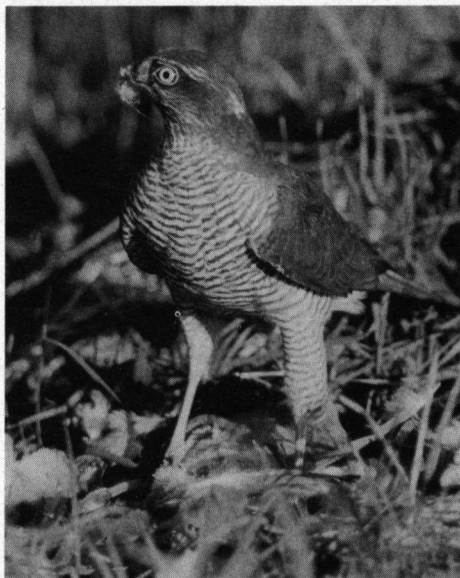
Wijfjes Sperwer.

dachtig het struikgewas beneden haar. Een minuut later drong zij zich door de binnenkant van het bosje naar beneden naar het eronder liggende grasveld, zat daar een poosje stil en trippelde vervolgens enkele meters over de grond tot het eind van de haag. Daar probeerde zij naar binnen te dringen om er haar prooi te pakken te krijgen. Een Huismus vloog op die plaats plotseling weg om op de plek waarnaar de Sperwer had zitten kijken weer in te vallen. Op deze mededeling kwam een reactie van Sjöquist (1978) die constateerde dat een Koolmees plotseling een beukenhaag binnenvloog, enkele ogenblikken later gevolgd door een \sigma Sperwer. De Sperwer ging precies op de plaats op de haag zitten waar de Koolmees naar binnen was gevlogen en klom toen naar beneden om er even later met de Koolmees in haar klauwen weer uit te komen. Onder dit artikeltje staat een noot