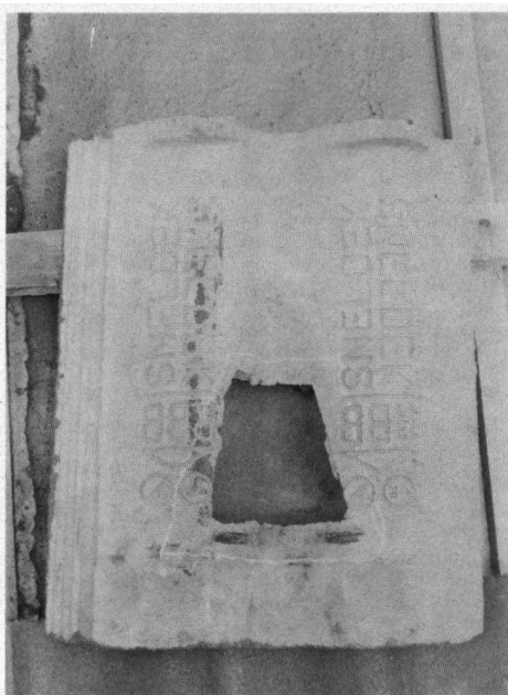
De zelfde gierzwaluw dakpan van RBB van onderen gezien.

Verder wordt onderzocht of het overgebleven geld gebruikt kan worden voor het uitgeven