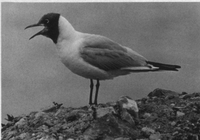
In Nederland werd voor de periode 1985-1988 de Kokmeeuw buiten de broedperiode beschikbaar gesteld voor de jacht. Dit ondanks drie onafhankelijk van elkaar verschenen rapporten waarin tot de conclusie wordt gekomen dat deze maatregel overbodig was.

Erger nog, in de Bondsrepubliek Duitsland heeft de regering drie Corviden te weten Zwarte Kraai, Ekster en Vlaamse Gaai, beschermd verklaard. Vrijwel tegelijk heeft zij bij de Europese Commissie een verzoek ingediend om deze soorten op een lijst (bijlage II/2) van vogels op te nemen die in bepaalde lidstaten bejaagbaar zijn. Het plotseling en volledig beschermen werkte als een provocatie bij belangengroepen. Daardoor weet de Bondsrepubliek Duitsland zich gesteund, terwijl van andere lidstaten ook niet veel sympathie voor de 'Corviden valt te verwachten. Indien dit verzoek van de Bondsrepubliek wordt gehonoreerd, zal de 'kraaienhofboom' ongetwijfeld ertoe leiden dat andere 'schadevogels' op de jachtlIJst worden geïntroduceerd. Ieder land heeft immers wel zijn eigen probleemvogels. Een hypothese? De tijd zal het leren.