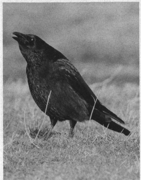
Welke gevolgen hebben het beschermd verklaren van de Zwarte Kraai in de Bondsrepubliek Duitsland?

Onlangs is door het Europese Hof van Justitie met de Nederlandse overheid het compromis bereikt dat het rapen van Kievitseieren onder bepaalde omstandigheden mag. Er moet een directe relatie bestaan tussen het rapen en de praktische bescherming. Het aantal rapers dient beperkt te zijn, de raaptijd dient te worden ingekort (6 april) en er moet