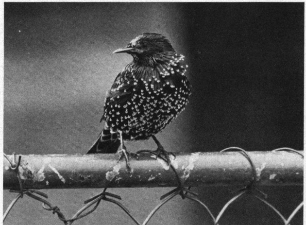
Ook voor de Spreuwen was een overvloed van nestkastjes neergehangen.

Enkele duurdere fijne coniferen ( Thuja's , Cypres , Juniperus , Taxus ) werden uitgeplant en hiertoe eerst bijna 20 m 3 zwarte grond in plantgaten gebracht. Van altijd groen blijvende heesters werden ook nog uitgezet: 40 hulsten, 100 laurierkers ( Prunus Laurocera-