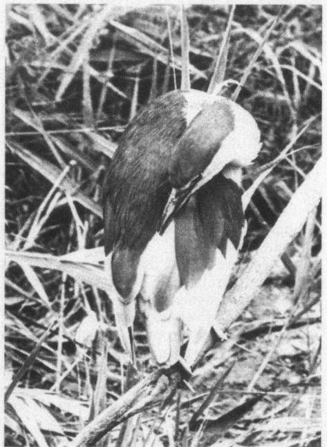
Met ' quacreyghers ' wordt de vogel bedoeld die wij tegenwoordig Kwak noemen.

Het Goudsche Bosch moet destijds aan een grote kolonie huisvesting hebben verleend. De rekeningen van Blois maken in 1358 melding van de oogst van 2000 quacreyghers en in 1359 en in 1360 van 1375 dezer vogels. In