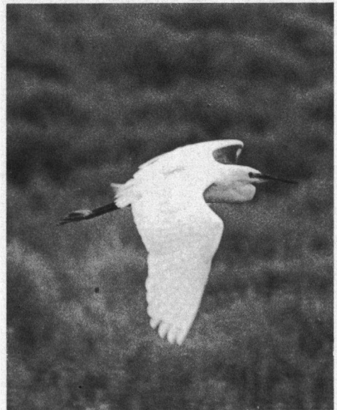
Sinds 1930 is de Kleine Zilverreiger herhaaldelijk in Nederland waargenomen en heeft in 1979 gebroed op de Oostvaardersplassen.

Voor een antwoord op de vraag welke van de twee zilverreigers in de 14de eeuw (en mogelijk ook al daarvoor) in het Goudsche Bosch zou hebben gebroed, geven de rekeningen van Blois wel enkele aanwijzingen. Niet die uit 1359, want daarin worden wel witte reigers genoemd, maar niet hun aantallen. De rekening van 1361 bevat echter een post, vermeldende de opbrengst van 800 Blauwe Reigers en Kwakken: 38 pond en 8 schellingen, en voor 500 witsvogels 6 pond en 5 schellingen. Als wij dit omrekenen, blijkt dat Blauwe Reigers en Kwakken (twee Kwakken worden in de rekening over 1358 gelijkgesteld met één Blauwe Reiger), gemiddeld vier maal zoveel opbrengen als de witsvogels. De witsvogel was dus blijkbaar een voor de consumptie minder betekende en dus waarschijnlijk ook kleinere soort. Als wij dan bovendien bedenken dat de Kleine Zilverreiger gaarne in bomen nestelt, ligt de veronderstelling voor de hand dat de witte reigers en witsvogels uit het Goudsche Bosch Kleine Zilverreigers waren.