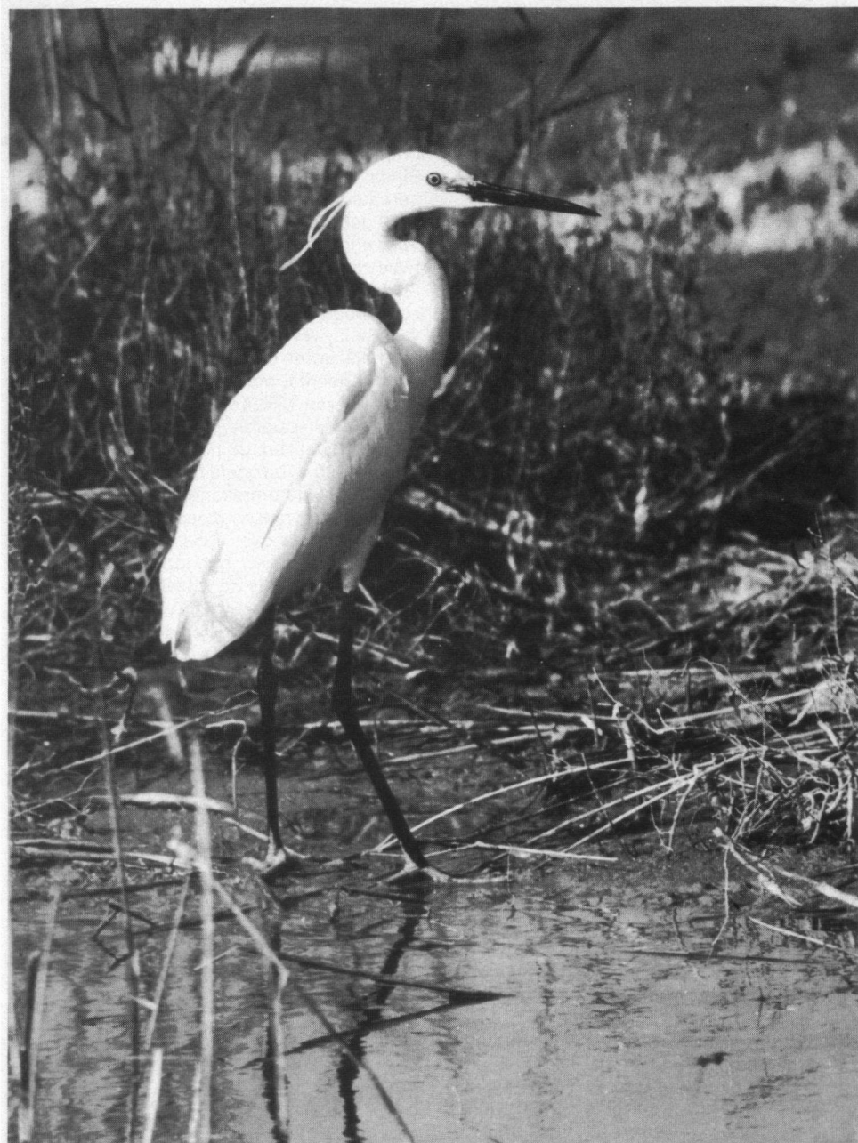
De veronderstelling ligt voor de hand dat de 'witten reyghers' en 'witsvogels' uit het Goudsche Bosch Kleine Zilverreigers zijn geweest.

■ Dr. A. Scheygrond, Van Itersonlaan 7, 2806 DD Gouda.