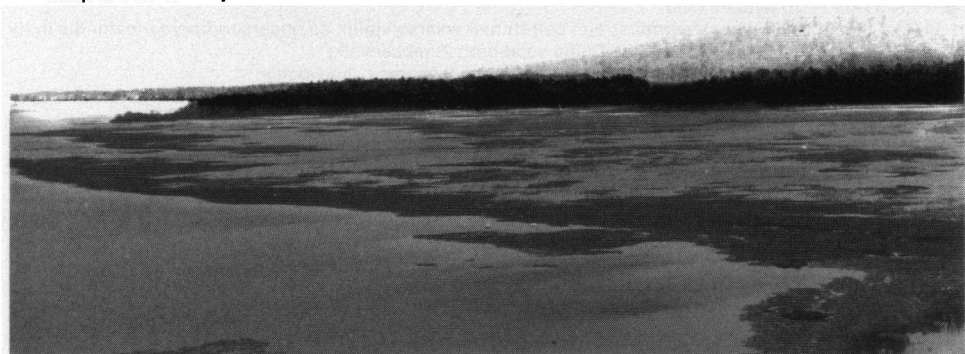
Uitzicht vanaf een uitkijktoren over Hornborgasjön.