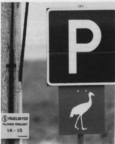
Parkeerborden voor kraanvogelvrienden.

dan komt men boven aan bij een huis. Links van dat huis gaat een weg de bossen in, men gaat echter rechtdoor en deze weg loopt dood. Dus men rijdt weer terug haast tot aan het einde, dan gaat een weg linksaf. Deze weg loopt ook dood. Rustig rijden en zijn daar vele vogelsoorten zo ook de Roodmus en Elanden... maar dan moet men daar 's avonds of 's morgens vroeg voor zijn, dan ziet men deze bijzonder mooie dieren. Blijf in de auto dan zijn ze het beste te observeren. Gaat men terug dan komt men vanaf een hoogte en dan heeft men een prachtig uitzicht over het reservaat. Beneden gekomen gaat men linksaf weer richting 'livswinkel'. Men krijgt dan aan de rechterkant een kiosk met frisdrank. Daar moet men 's avonds