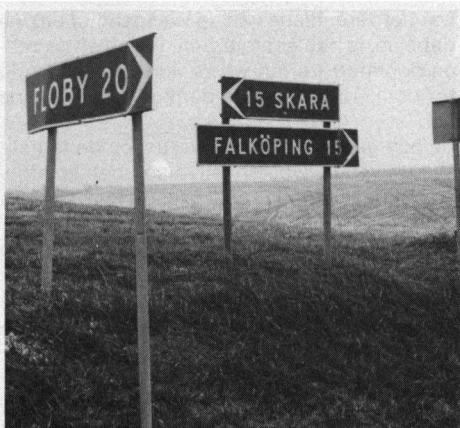
Daar gaat men rechtsaf naar Skara.