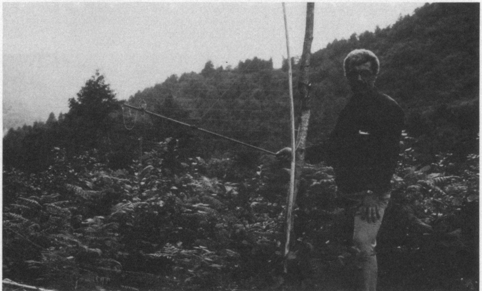
Met behulp van een rechtopstaand net en een Grauwe Klauwier worden de Sperwers op hun doortocht belaagd. Armonik, september 1982. Naar een kleurendia van Jan Benoist.

Dieper in het Pontisch Gebergte ligt een klein bergdorpje waar in de zomer de bergboeren wonen. Twee nachten mochten wij doorbrengen bij enkele families in dit dorpje, Salikör genaamd. Het belangrijkste middel van bestaan is de veehouderij. De koeien worden geweid op de schamele bergweiden. Het hooi