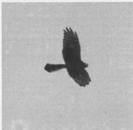
Een overtrekkende Steppenklekendief bij Salikör, september 1982.

Ons verblijf hier leverde ons een groot aantal waarnemingen op, zoals onder andere: Steenarend, Slangenarend, Aasgier, Vale Gier, Lammergier, Boomvalk, Bijeneter, Alpenkraai, Grijs Gors, Steppenbuizerd en Aziatische Steenpatrijs. Veel van de waargenomen vogels waren duidelijk op trek. Boven het dorpje wemelde het van de Huis-, Boeren- en Oeverzwaluwen. De Ortolanen foerageerden tussen de huisjes. De ongerepte schoonheid van de natuur doet het gemis aan comfort snel vergeten. 's Zomers is het hier goed toeven, maar 's winters zal het hier flink spoken, getuige het feit dat zelfs de bergboeren naar andere oorden vertrekken.