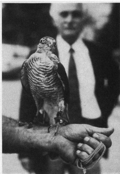
De 'trotse' eigenaar toont zijn Sperwer. Een handschoen vindt hij niet nodig. Arhair, september 1982.

streek. De plaatselijke bevolking is erg vriendelijk en gastvrij en zij proberen hun eventuele armoede zoveel mogelijk verborgen te houden. Het rapen van hazelnoten wordt meestal gedaan als bijverdienste. Ook het vangen van Sperwers is voor sommigen een bijverdien-