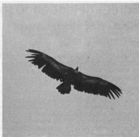
Tijdens ons verblijf werden ook Vale Gieren gezien. Salikör, september 1982.

Nog verder naar het zuiden, nabij Erzurum een grotere plaats met een vliegveld, vinden wij een grote hoogvlakte, omsloten door bergtoppen. Vele stootvogels, welke nog steeds hun route naar het zuiden vervolgen, maken gebruik van deze hoogvlakte. Niet alleen van de aanwezige thermiek maar ook om te foerageren. Aan de rand van Erzurum bevindt zich een slachthuis, de tafelen die zich hier voordoen en kennelijk heel gewoon zijn, zouden bij ons aanleiding zijn voor een rel waarbij de volgsgezondheid in het geding zou zijn. Het slachtafval wordt ofwel in het