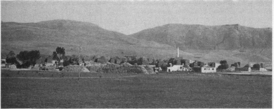
Tijdens de trek is de hoogvlakte Ersurum een waar vogeleldorado.