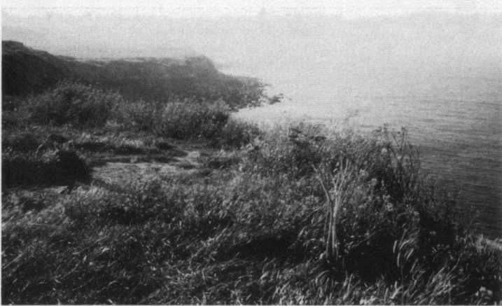
De rotsformatie bij Cap Gris Nez is verreweg de beste plaats langs de Franse noordkust om in de herfst zeevogels en vogeltrek waar te nemen. Naar een kleurendia van Frits Siskens.

Naast de vogelkijkpunten op Cap Gris Nez leent het gehele gebied zich uitstekend voor vogelexcursies.