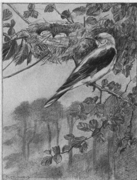
Wielewaal bij het nest. Tekening: Sjoerd Kuperus.

Alleen 'Een tweede jaar in Thijsse's Hof' ver-