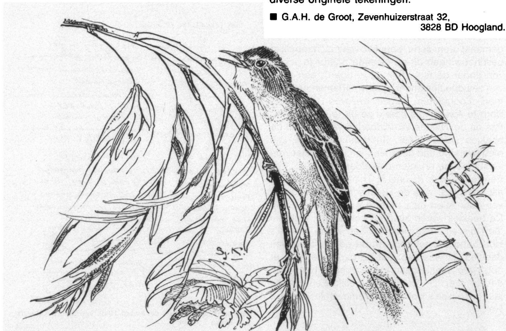
Grote Karekiet zingend. Tekening: Sjoerd Kuperus.

■ G.A.H. de Groot, Zevenhuizerstraat 32, 3828 BD Hoogland.