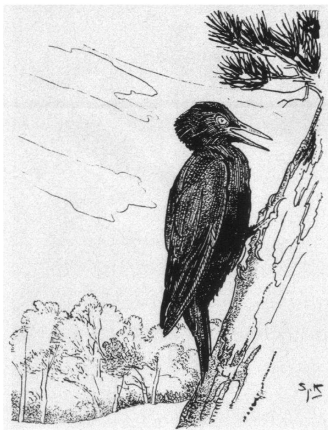
Zwarte Specht. Tekening: Sjoerd Kuperus.

In het laatste artikel dat Thijssen schreef in zijn tijdschrift 'De Levende Natuur', december 1946, jaargang 49, aflevering 6, gebruikte hij nog eens de tekening van de Glanskop.