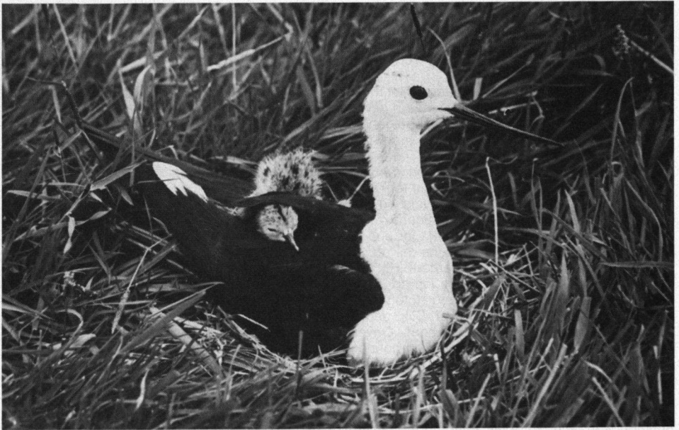
In 1935 broedden de Steltkluten in het Oostzijderveld.