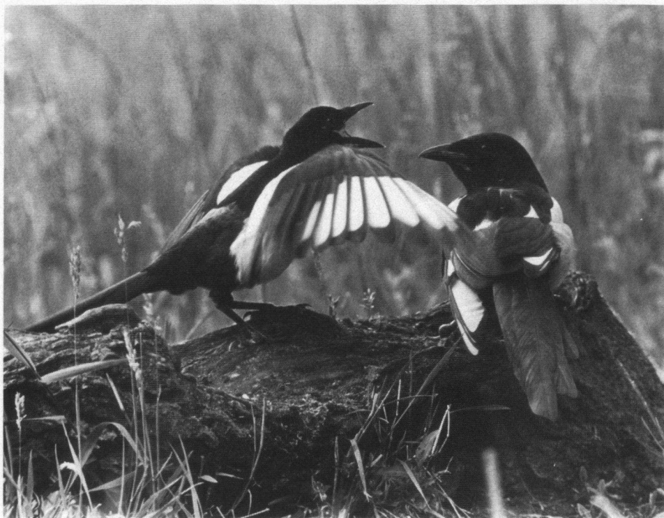
Derde aanmoedigingsprijs. Eksters, Ackerdijkse Plassen, gem. Pijnacker, 25 juni 1988. Canon A1, Telyt 400 mm.