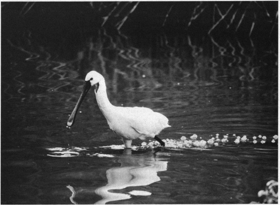
Eerste aanmoedigingsprijs. Foeragerende Lepelaar, Oostvaardersplassen, juli 1988. Nikon F3, Nikon 600 mm.