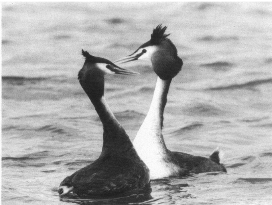
Derde prijs. Kopschuddende Futen, Wijde Wormer, april 1988. Nikon F3, Telyt 400 mm.

De overige foto's die voor punten in aanmerking kwamen, laten wij hieronder in volgorde volgen: