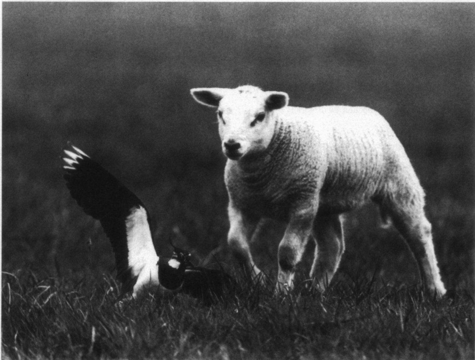
Twede prijs. Afleidingsgedrag van Kievit, Wijde Wormer, mei 1988. Nikon F2, Telyt 560 mm.