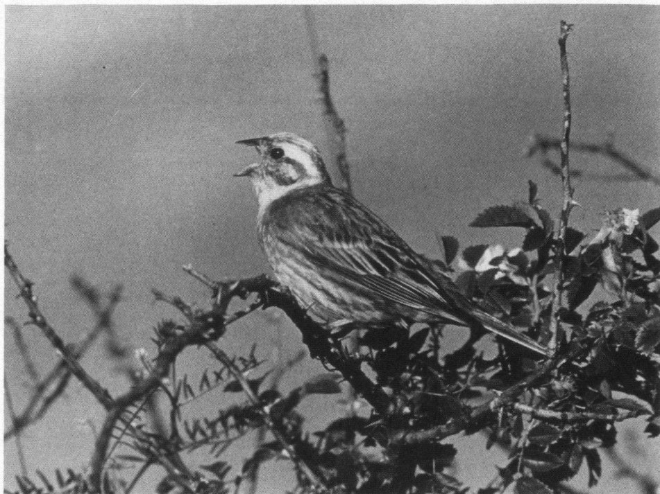
Geelgors, Leiwars, West-Duitsland, juli 1987. Pentax LX, Noflexur 600 mm.