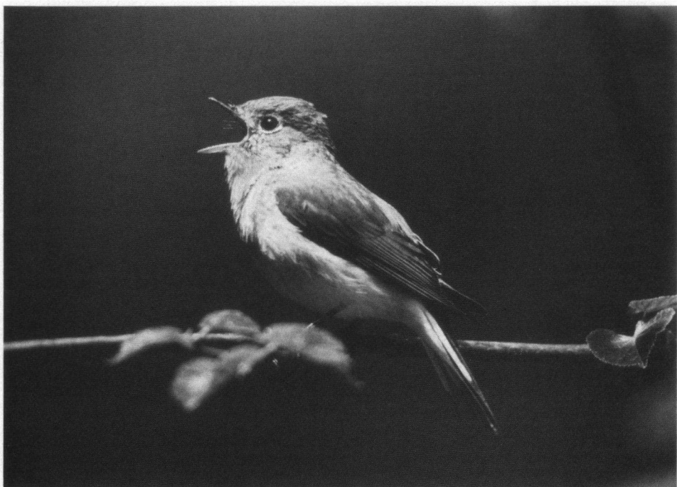
Kleine Vliegenvanger, Breda, juni 1988. Nikon F3, Nikon 600 mm.