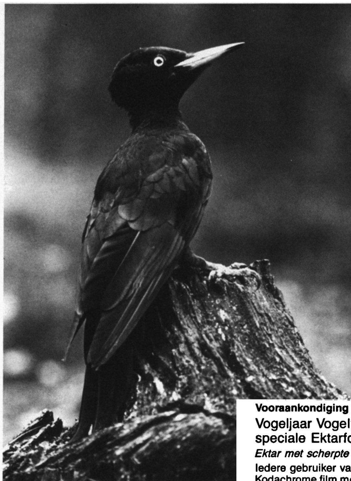
Zwarte Specht, Staphorst, 17 oktober 1987. Nikon FE-2, Telyt 400 mm.