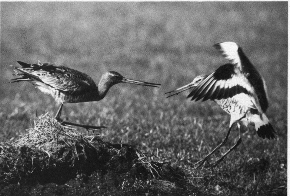
Tweede aanmoedigingsprijs. Dreigende Grutto's, Enge Wormer, maart 1988. Nikon F3, Telyt 560 mm.