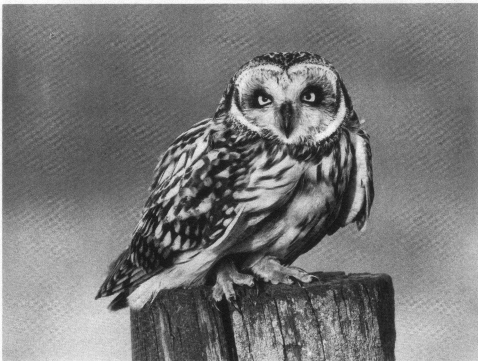
Velduil, tussen Serooskerke en Moriaanshoofd, Schouwen-Duiveland, 13 februari 1988. Nikon FE, Nikon 600 mm.