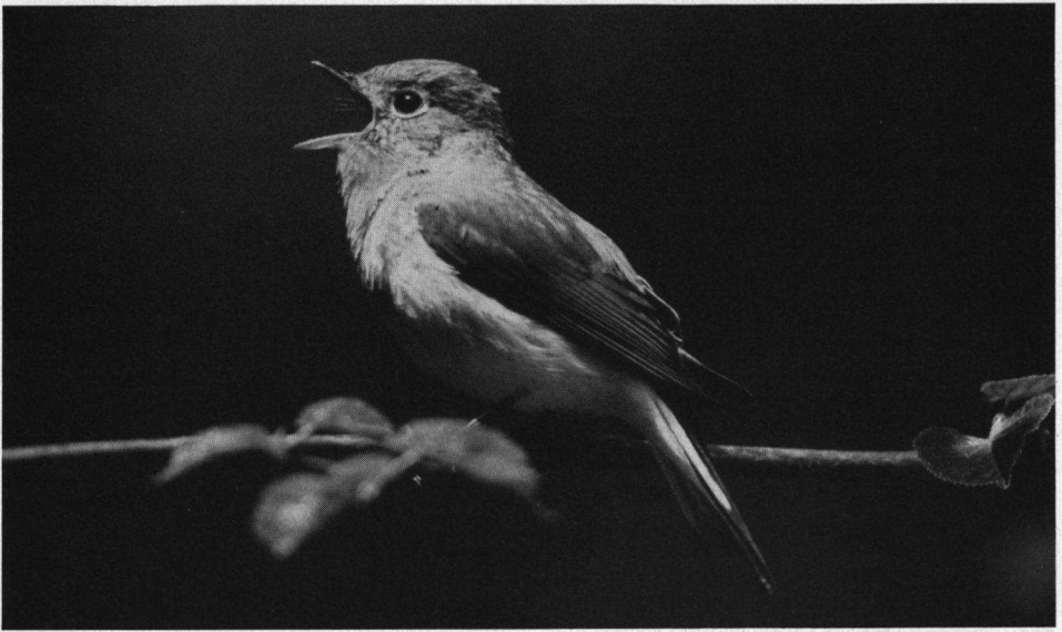
Zingende Kleine Vliegenvanger, Breda juni 1988.