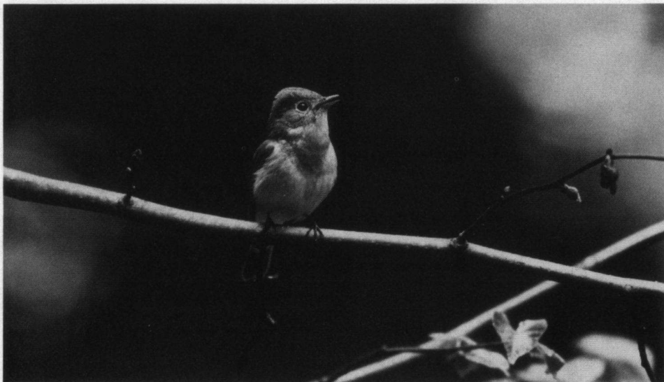
Zingende Kleine Vliegenvanger, Breda, mei 1988.

Hij zit nu op een dode eikestomp ongeveer zes meter hoog en zingt uit volle borst. De verklaring voor het af en toe dubbele geluid komt nu ook; het vrouwtje strijkt korte antwoordjes gevend neer op de zelfde tak. De witte staartbuitenkan-ten zijn goed te zien ( 2/3 van de staartlengte), het ♀ heeft geen bijzondere vleugeltekening. Het rood van het ♂ loopt door tot de snavelbasis en tot bijna onder het oog. Overigens is niet alleen de keel rood maar ook een deel van de borst. Sa-