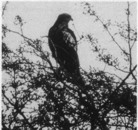
Het vierde jong had slechts hier en daar wat wit op de vleugels.