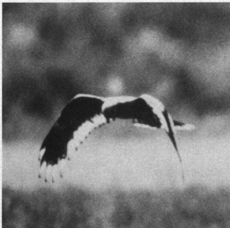
Het derde exemplaar was op de bovenzvleugels halfbont en aan de onderzijde slechts 20% wit. Naar een kleurendia van Bouke Grootjans.

lijkt te bezitten. De tweede vogel bezit een normaal verenkleed. Als de vogels opvliegen ont-popt zich een verbazingwekkend schouwspel. De in afwijkend verenkleed gestoken vogel bezit helder witte bovenzvleugels en rug met uitzondering van een beide vleugeltoppen verbindende, over de achtervleugel lopende smalle donkere band. De achterrand van de vleugel is weer wit en dat wit 'slaat om' naar de ondervleugels die ook voor circa 50% wit zijn. Op de buik bezit de vogel een ovale lichte vlek, niet wit. Op een zeker moment steeg uit het gebied een tweede, in hoge mate in identiek gestoken verenkleed op. Al spoedig streek deze vogel weer neer. De eerste vogel verwijderd zich steeds verder, maar kon langdurig worden waargenomen. Niet vast komt te staan of ook boven de Slikken van de Heen opererende adulte Bruine Kiekendieven een speciale band met beide afwijkend getinte