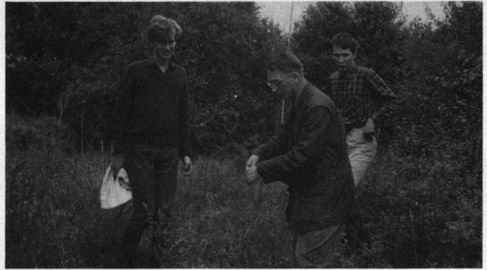
Ringwerkzaamheden in het Groene Slop, Schiermonnikoog, 1966.