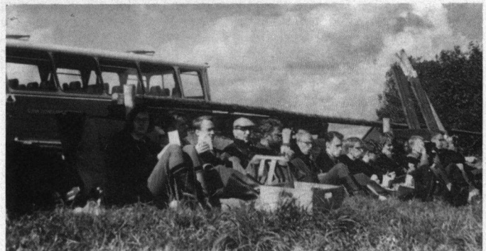
Excursie van biologiestudenten van de Gemeentelijke Universiteit Amsterdam naar Falsterbo, Zweden, 1965.