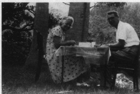
Vogels prepareren, The Bottom, Saba, februari 1952.