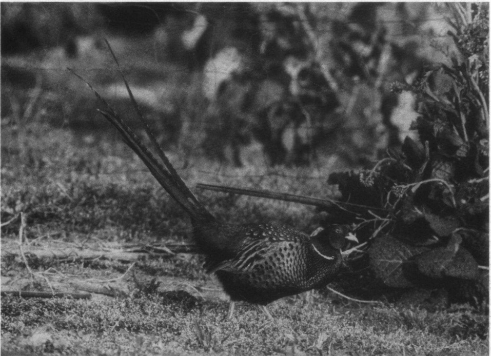
Voor een kip die de weg oploopt remt een weldenkend mens net zo goed als voor een overvliegende Fazant.

Dierenbeschermers en natuurbeschermers leven in twee werelden. Weliswaar nemen dierenbeschermers de grenzen niet zo nauw (zij richten zich ook wel eens tegen de sportjacht), maar door de bank genomen zijn huisdieren toch hun voornaamste zorg. Natuurbeschermers betreden dat terrein nimmer. Ik heb de indruk dat zij met een zekere neerbuigendheid op die 'sentimentele' dierenbeschermers neerzien. In ieder