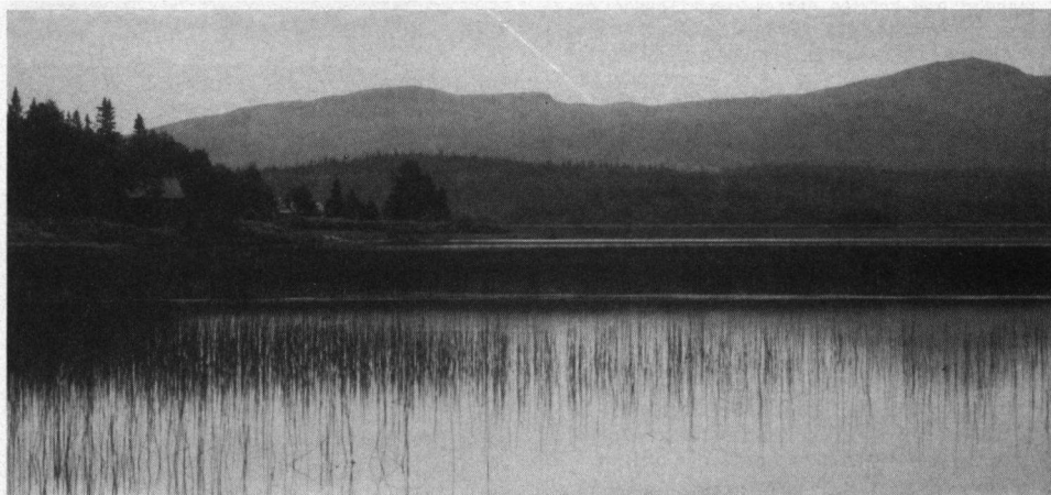
De vierde hut Halsenmossen staat vrij hoog en geeft een goed uitzicht over grote delen van het meer.