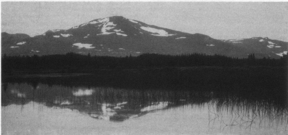
Een van de bekendste vogelgebieden in Zweden is het Ånnsjön.