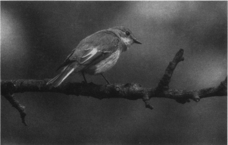
Dank zij de nestkasten heeft het ringonderzoek er veel toe bijgedragen de verspreiding van de Bonte Vliegenvanger nauwkeurig te kunnen volgen. Op de foto een wijfje.

Geruzie tussen Koolmees en Bonte Vliegenvanger. Etagebouw. Op 14 mei Koolmees op nestmateriaal Bonte Vliegenvanger. Koolmees broedt. 5 juni, Koolmees heeft vijf eieren van Bonte Vliegenvanger uitgebroed! De vijf jongen zijn door de pleegouders prima verzorgd en dertien dagen na het uitkomen uitgevlogen. Ze zijn geringd door Aart Smit, Nunspeet. De vraag blijft, wat gebeurt er met deze jongen?