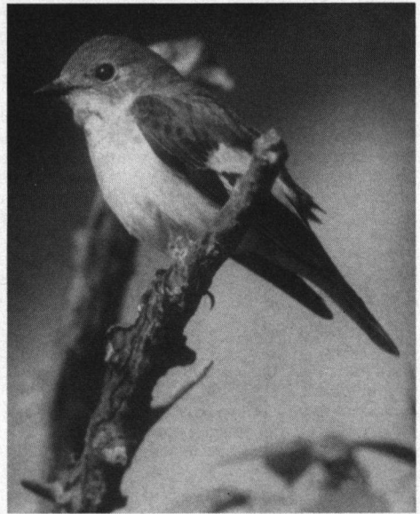
Vooraf de Bonte Vliegenvanger dreigt van het verwijderen van de nestkasten de dupe te worden.

Waar het onze kwestie betreft, gaat het over culturbos/monocultuur, welke in een miserabele staat verkeert. Wil men daar een zogenaamd 'systeembos' van maken - en dat geldt voor al onze bossen - dan duurt dat 'mensenlevens' lang, zo het al lukt met de huidige milieuvervuiling. Vanaf 1960 tot op heden heb ik nog weinig verbetering daaromtrent gezien. Het belachelijke