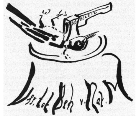
De Bonte Vliegenvanger niet op het offerblok

Het gevaar bestaat dat het beleid van 'Natuurmonumenten' door andere natuurbeschermingsinstanties kritiekloos wordt overgenomen, zoals nu al het geval blijkt te zijn bij Staatsbosbeheer in Nunspeet en 'De Buunderkamp' bij Arnhem. Steeds weer zijn 'nestkasten' onderwerp van discussie. Zie hiervoor 'Vogels' nummer 3 van mei/juni 1981. 'Zin en onzin bij het plaatsen van nestkasten' naar aanleiding van het rapport van de heren Braaksma & Boere in de 'Lepelaar' nummer 67 van maart/april 1980. Het feit dat nestkasten wel kunnen worden geaccepteerd voor 'wetenschappelijke en educatieve doeleinden' gaat uit van de belangstelling die mensen hebben voor vogels, in plaats van het belang dat vogels hebben bij hulp van de mens.