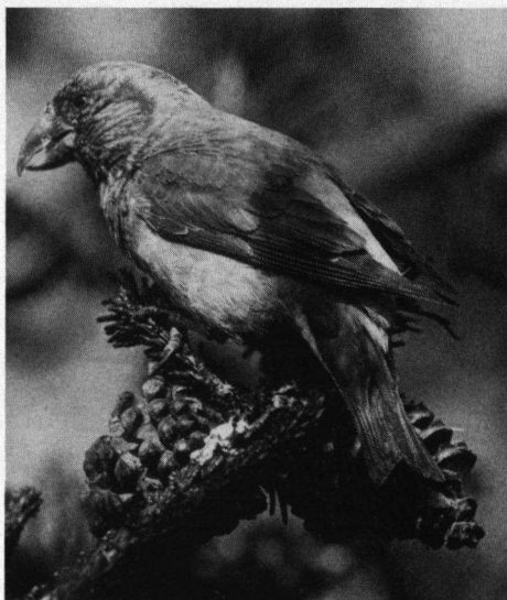
Vrouwtjes Kruisbek, Westduinpark, Den Haag, 25 augustus 1990.