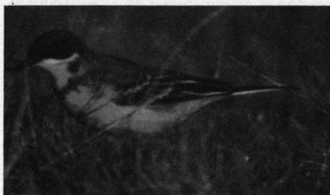
Noorderse Gele Kwikstaart, Bovenwater, O.Flevoland, 5 mei 1990.

Zwarte Specht. 29-4-90 1 paar Clinge Bos, Hulst (M.A. Capello, W. Wisse); 12-6-90 1 ex. aldaar (T. Ysebaert).