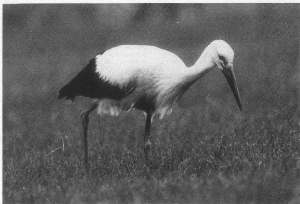
Op de najaarstrek werden aanzienlijk minder exemplaren waargenomen dan op de voorjaarstrek.