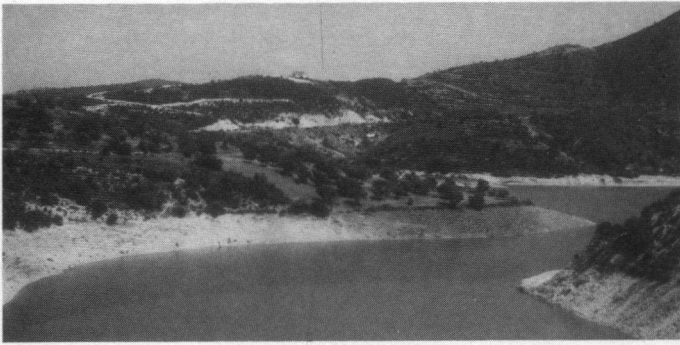
Germasogeladam ten noordoosten van Limassol.

sche centra grote dammen (zie foto 2) gebouwd en heeft men dalen onder water laten stromen. Daarmee verdwijnen de oorspronkelijke riviertjes en de rivierbeddingen liggen dan ook grotendeels droog. Het spreekt voor zich dat de tol voor flora en fauna hoog is. En het lijkt er niet op dat aan de biotoopvernietiging op korte termijn een einde zal komen, ook al is er door de regering inmiddels een bouwstop uitgevaardigd. In de omgeving van Paphos bijvoorbeeld wordt momenteel zo veel nieuwbouw gerealiseerd, dat de plaats in omvang bijna verdubbelt.