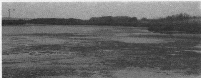
Poel nabij Lady's Mile ten zuiden van Limassol.

Bij het verlaten van Limassol in de richting van Larnaca valt op dat Cyprus ten prooi valt aan een gigantische roofofbouw op het natuurlijk milieu. Dit alles ter meerdere eere en glorie van het massatoerisme. Over een afstand van 15 kilometer is de kustlijn volgebouwd met hotels en appartementen. Om in de waterbehoefte van toeristen te kunnen voorzien, zijn in de buurt van toeristi-